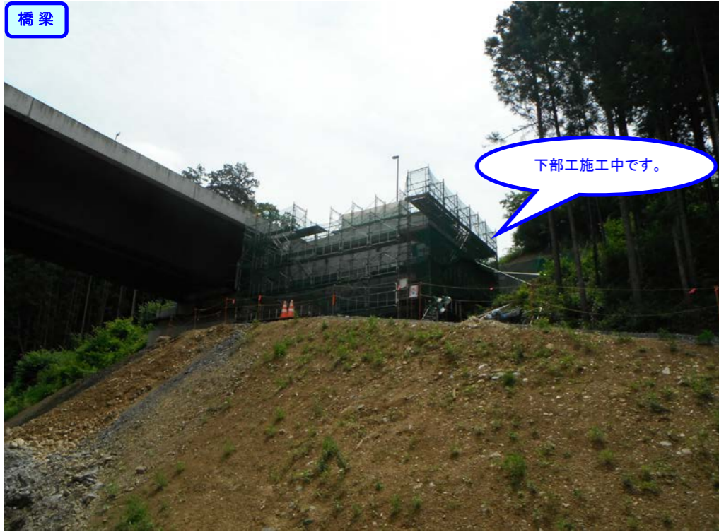
③ 起点側から終点側を望む 山居沢橋 橋台(A2)