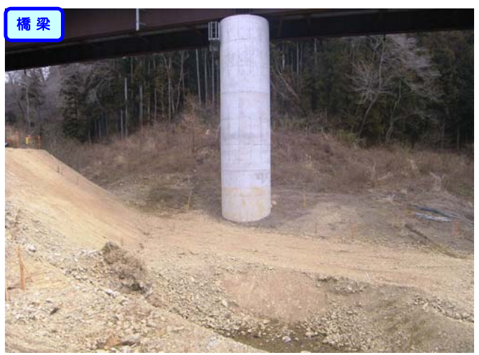
場内工事用道路を造成しています。