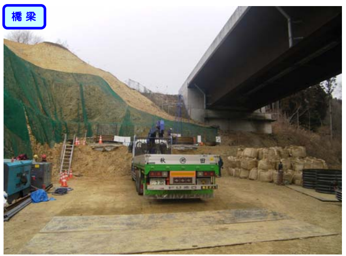
③ No.457から終点側を望む 山居沢橋 橋台(A2)