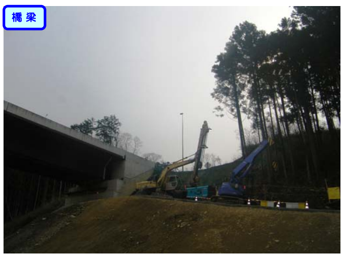
床掘作業をしています。