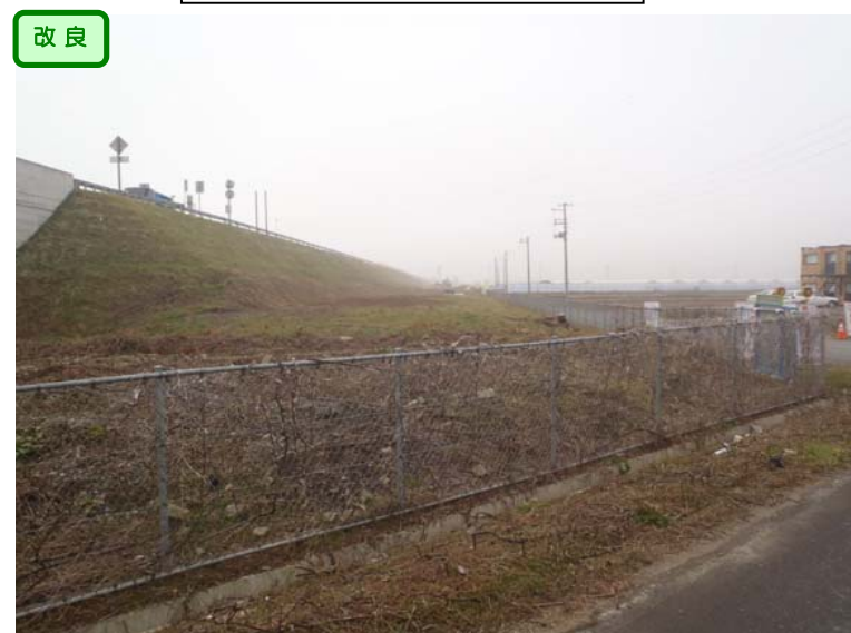
軟弱地盤対策としての地盤改良が完了しました。