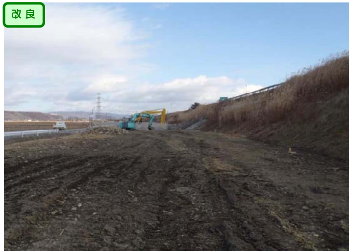
④ No.120から終点側を望む