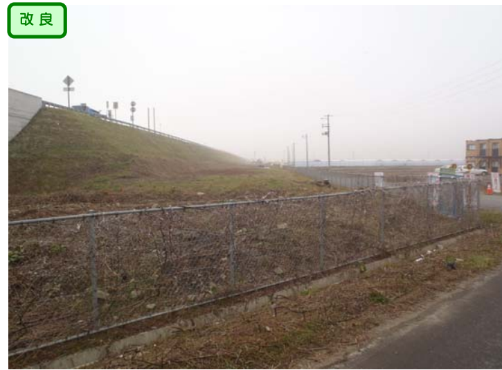
① No.1000から終点側を望む