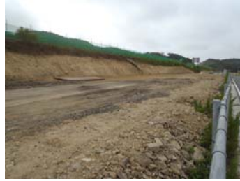
③ No.262から起点側を望む