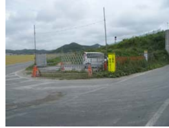
⑥ No.282から終点側を望む