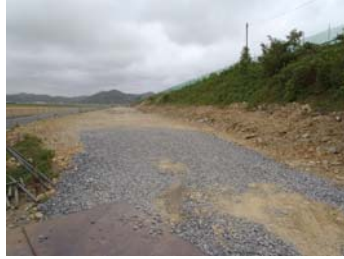
② No.244から終点側を望む