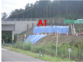
① 町道からNo.236を望む 崎山橋 橋台(A1 A2)