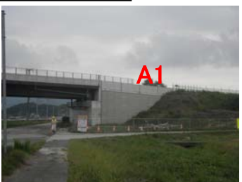
⑪ No.323から終点側を望む