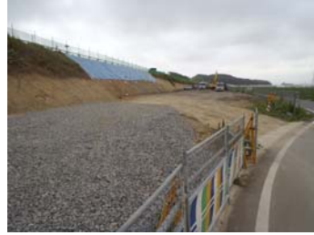
⑤ No.281から起点側を望む