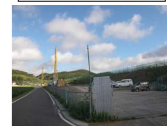
⑬ No.374から終点側を望む