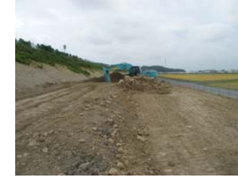
⑦ No.300から起点側を望む