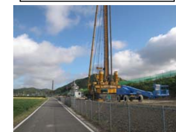
⑪ No.323から終点側を望む