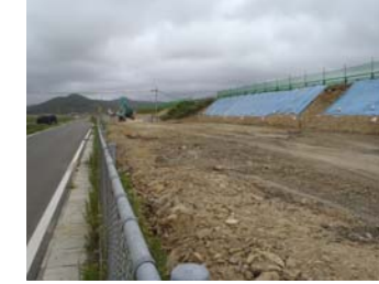
④ No.262から終点側を望む