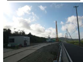
⑫ No.343から起点側を望む