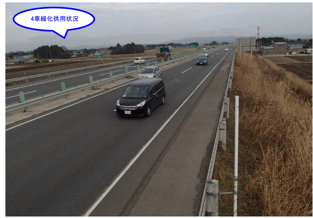
③ 起点側から終点側を望む