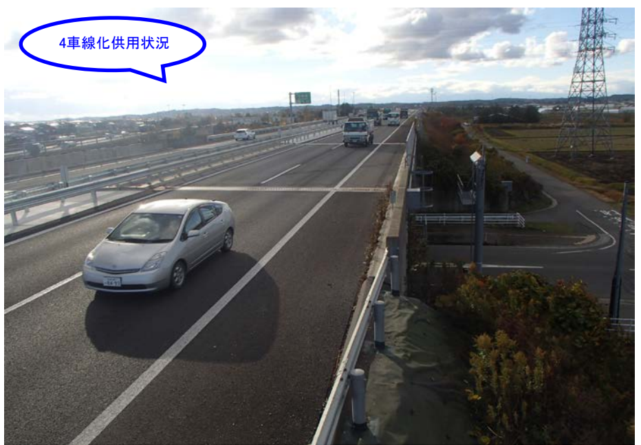
③ 終点側から起点側を望む