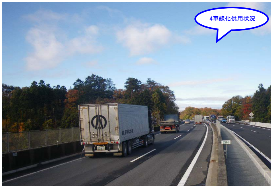
③ No.600から終点側を望む