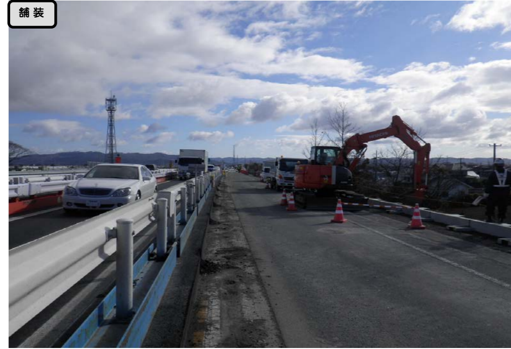
② No.820から起点側を望む