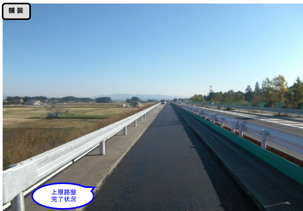
上層路盤完了状況