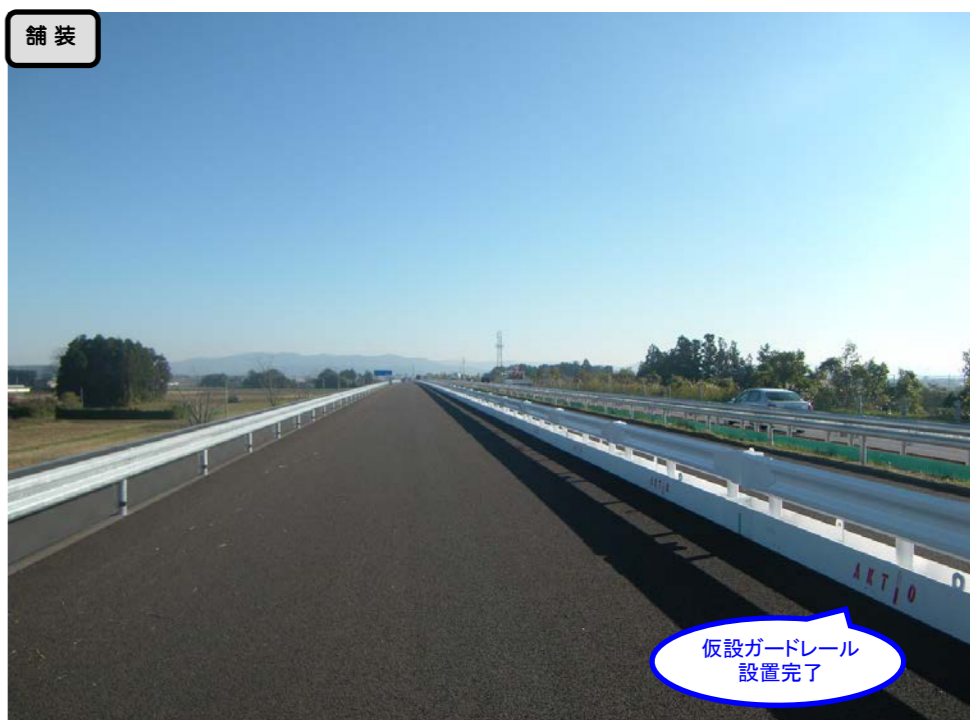
仮設ガードレール設置完了