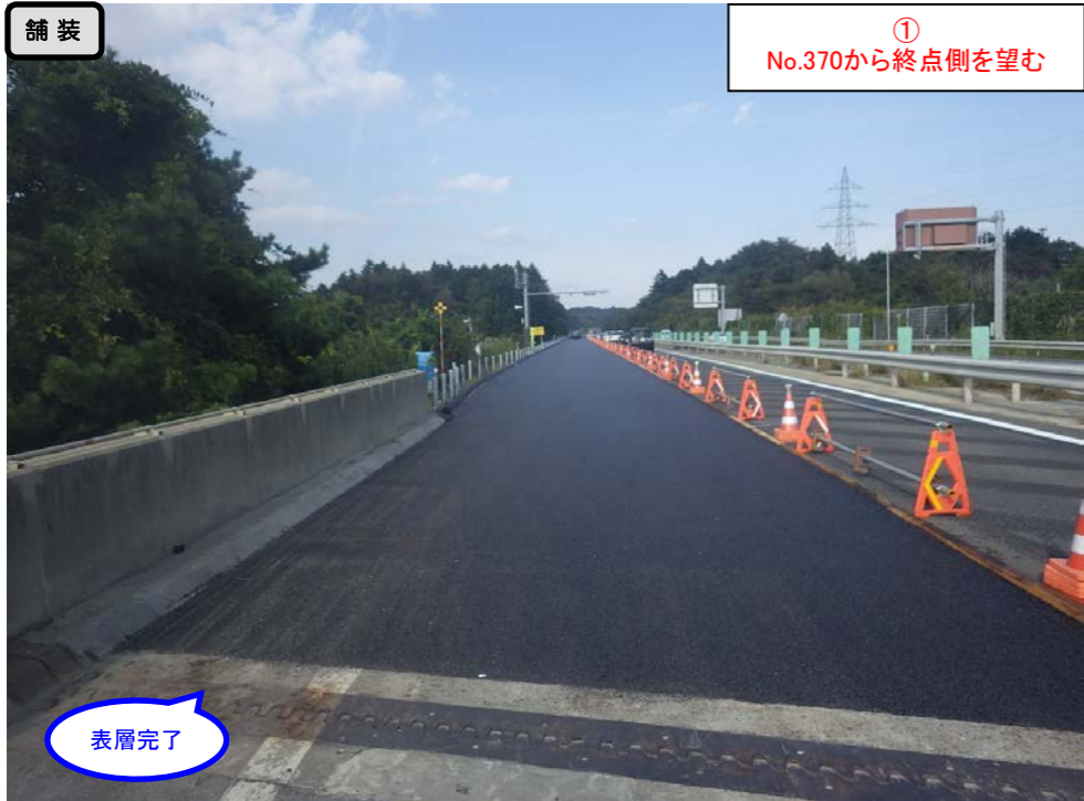
① No.370から終点側を望む

< 鳴瀬奥松島IC～石巻河南ICの延長12.4kmを4車線化事業中(2車線無料供用中) >