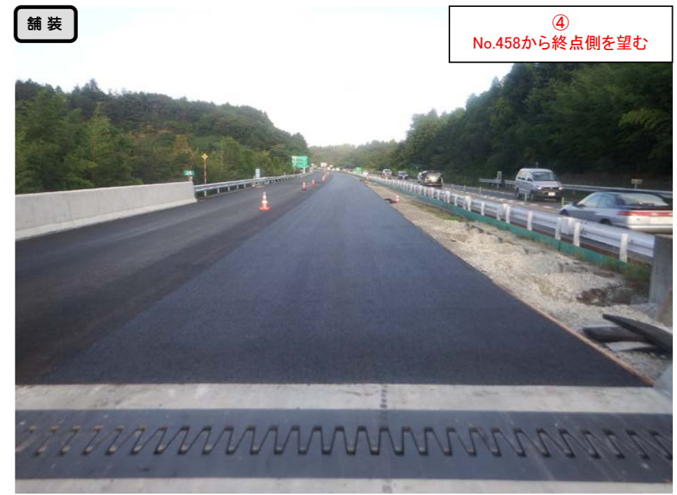
④ No.458から終点側を望む