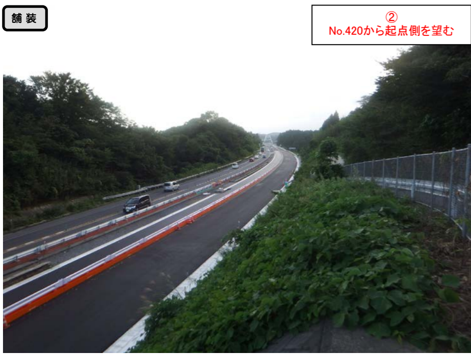
② No.420から起点側を望む