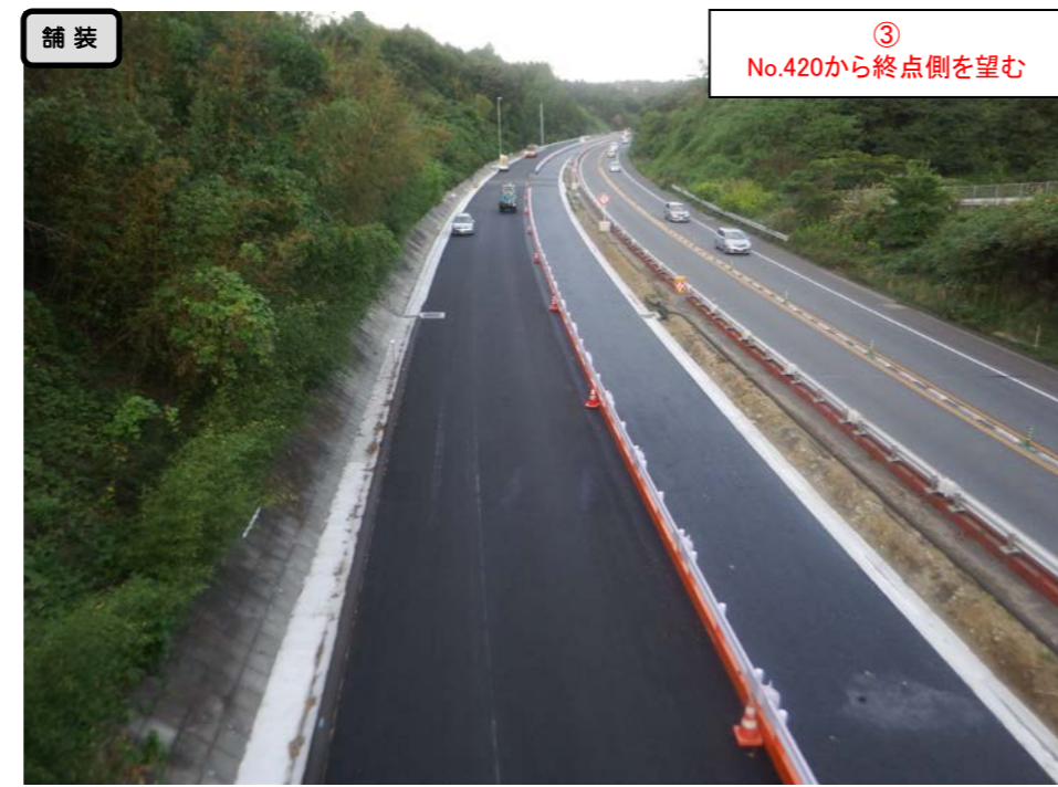
③ No.420から終点側を望む