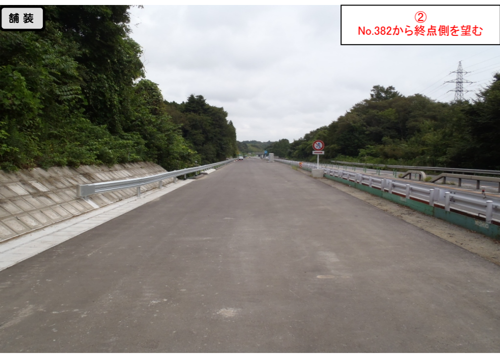
② No.382から終点側を望む

大塩地区改良舗装工事 受注者：前田道路(株) 工期：H26.4.1～H27.3.16