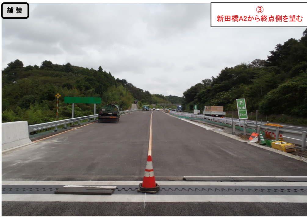
③ 新田橋A2から終点側を望む