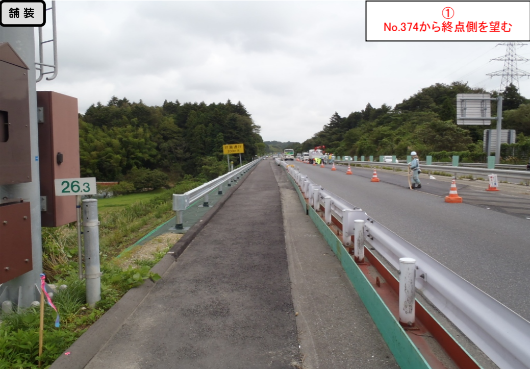
① No.374から終点側を望む