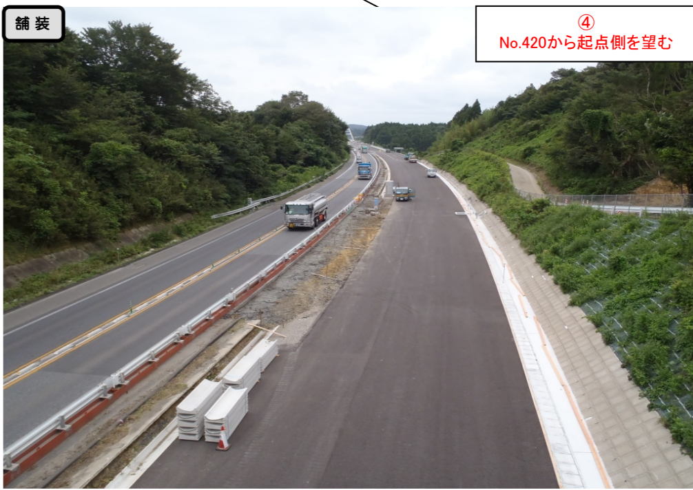
④ No.420から起点側を望む