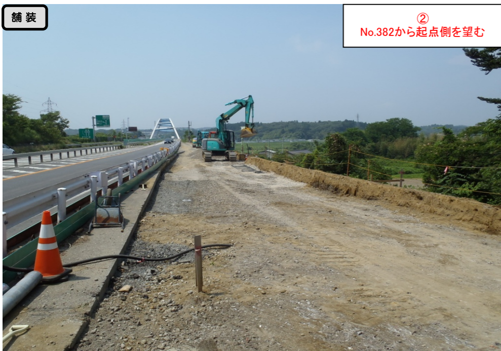
舗装 ② No.382から起点側を望む