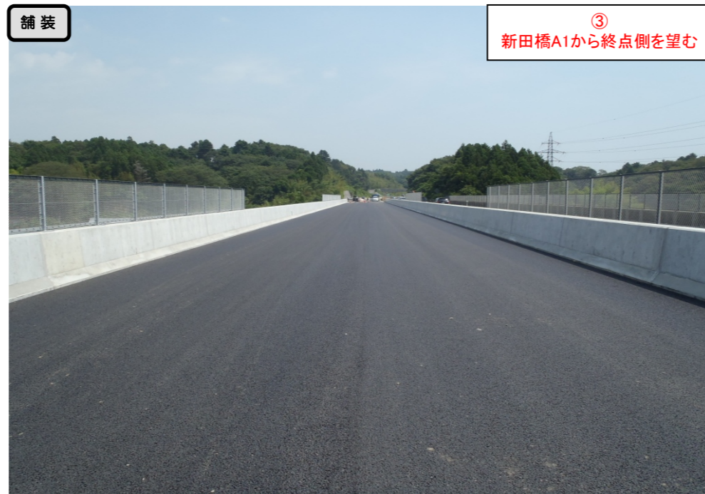
舗装 ③ 新田橋A1から終点側を望む