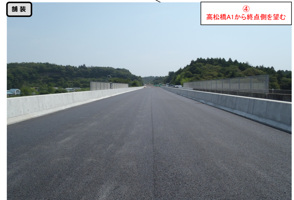
舗装 ④ 高松橋A1から終点側を望む