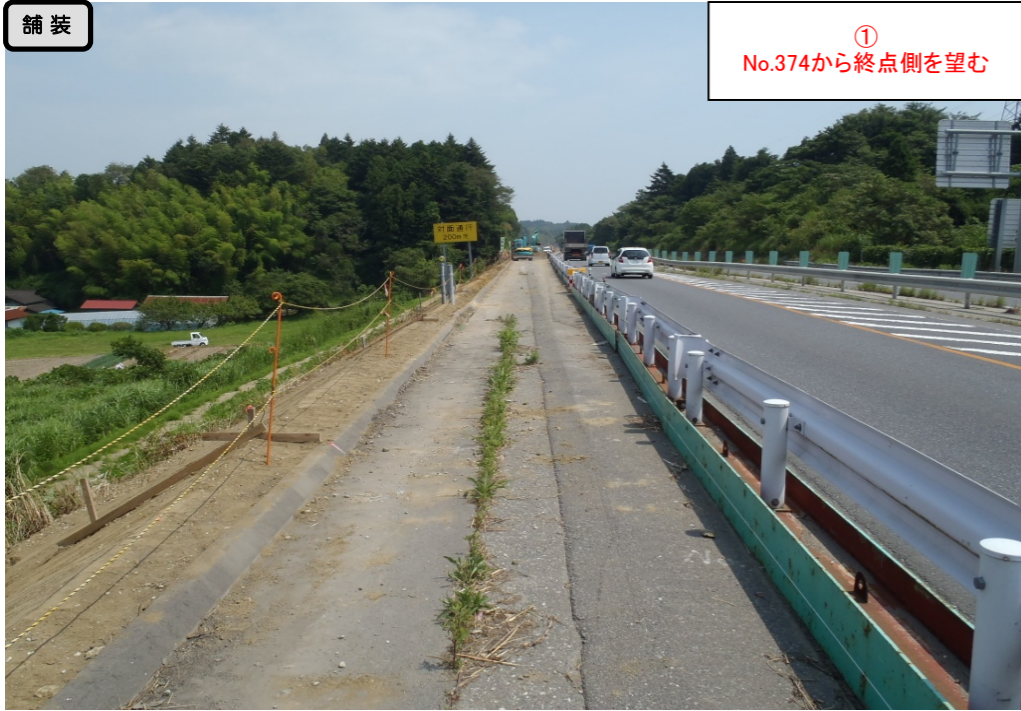
舗装 ① No.374から終点側を望む

< 鳴瀬奥松島IC～石巻河南ICの延長12.4kmを4車線化事業中(2車線無料供用中) >