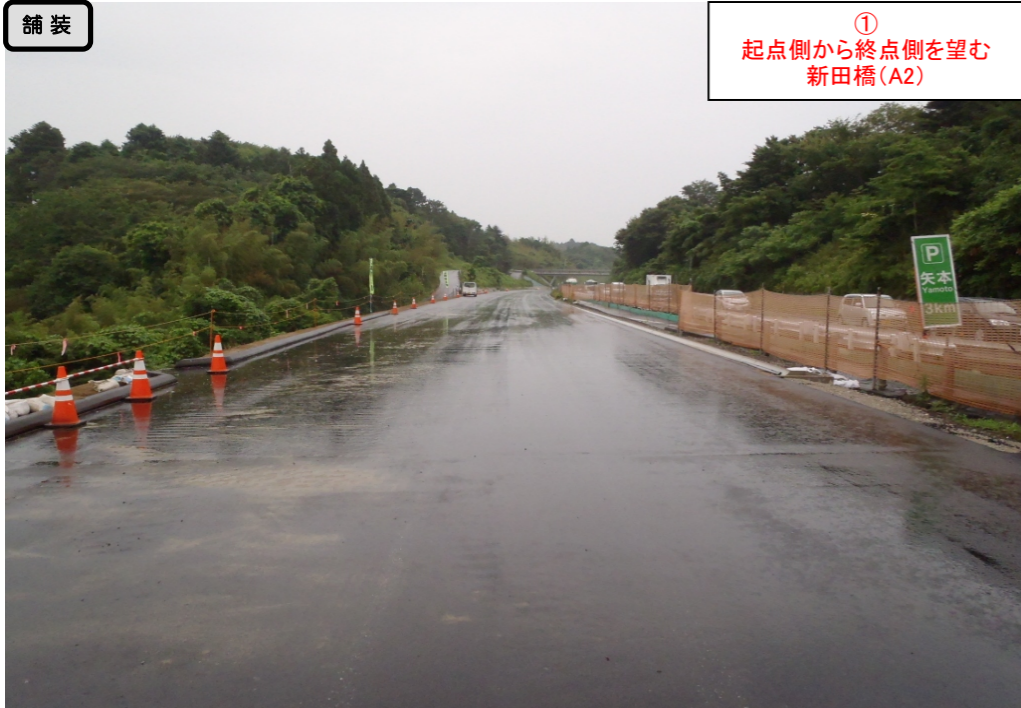
① 起点側から終点側を望む 新田橋(A2)

< 鳴瀬奥松島IC～石巻河南ICの延長12.4kmを4車線化事業中(2車線無料供用中) >