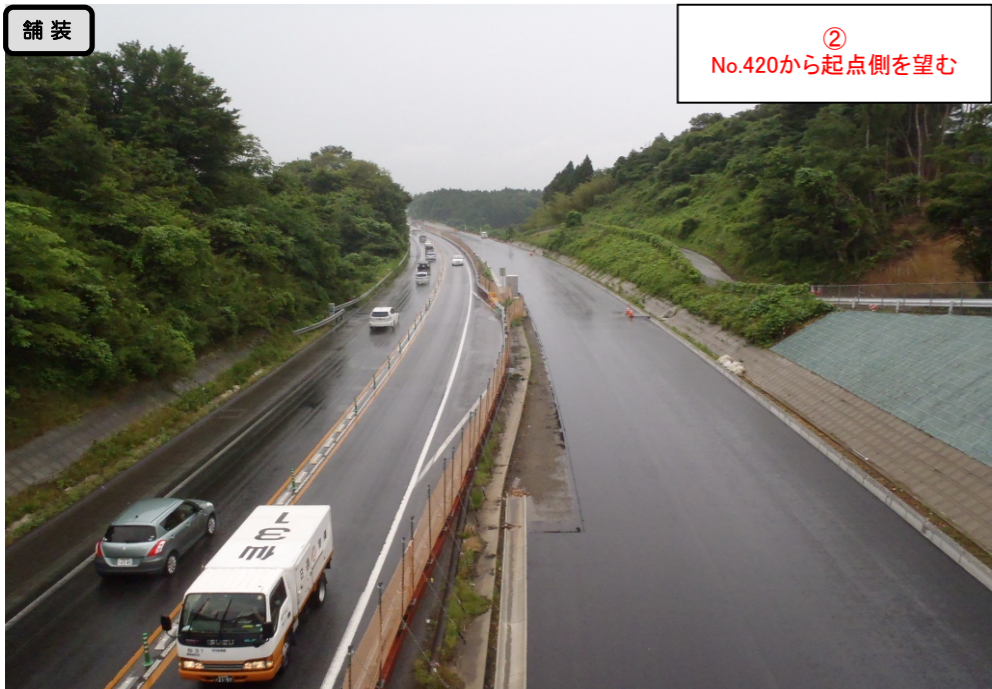
② No.420から起点側を望む