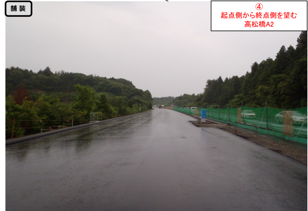
④ 起点側から終点側を望む 高松橋A2