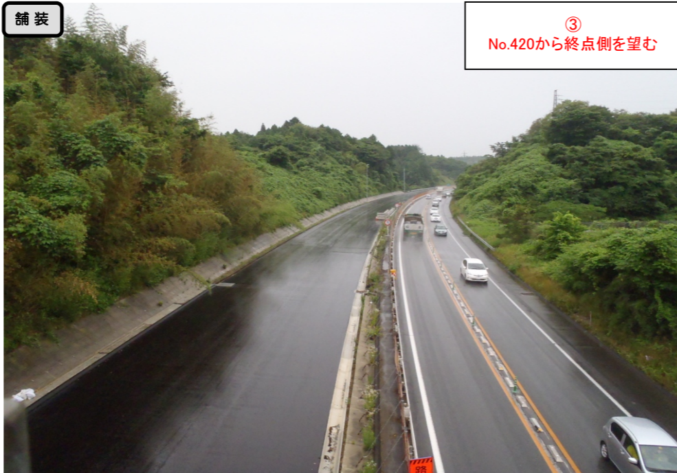
③ No.420から終点側を望む