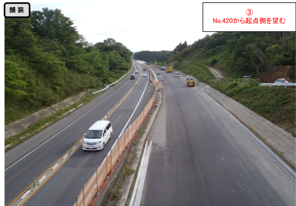
舗装 ③ No.420から起点側を望む