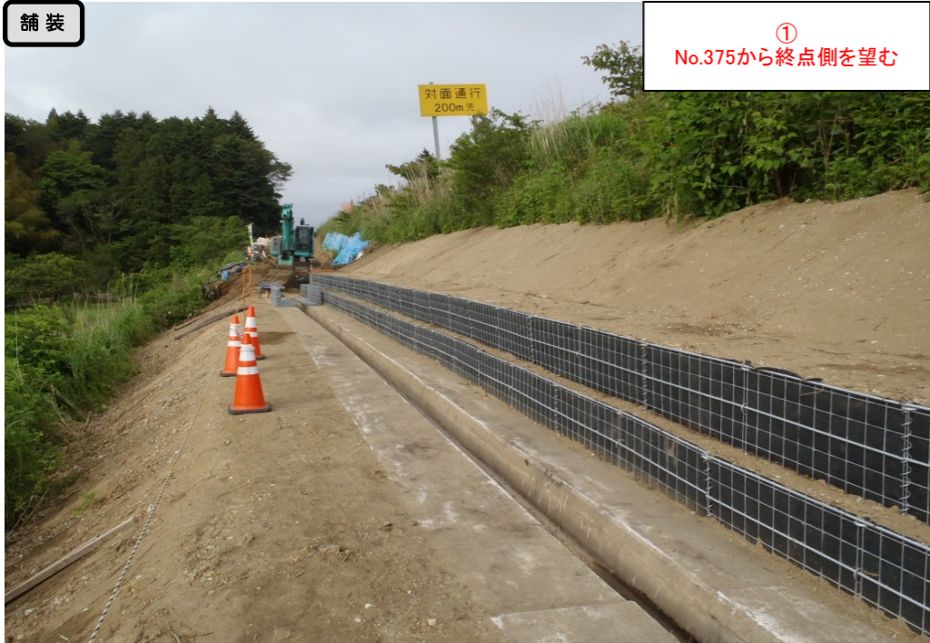
舗装 ① No.375から終点側を望む

< 鳴瀬奥松島IC～石巻河南ICの延長12.4kmを4車線化事業中(2車線無料供用中) >