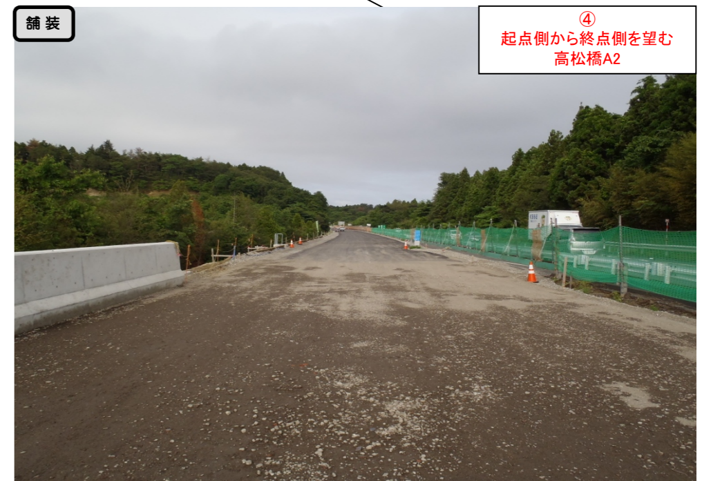
舗装 ④ 起点側から終点側を望む 高松橋A2