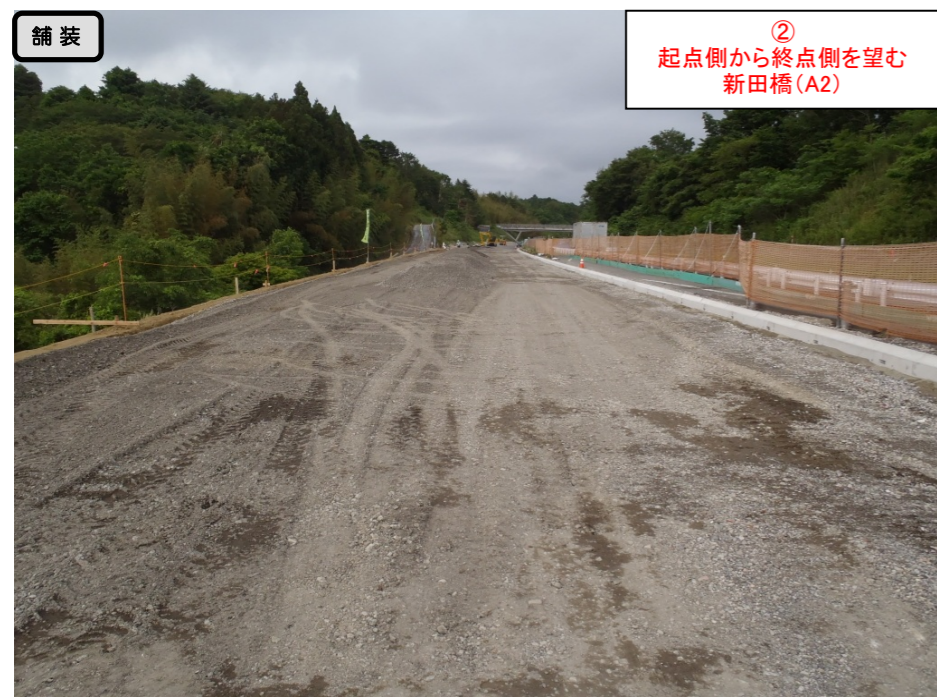
舗装 ② 起点側から終点側を望む 新田橋(A2)