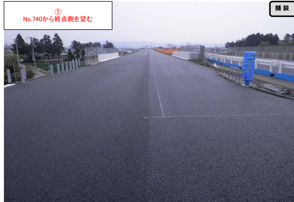
① No.740から終点側を望む