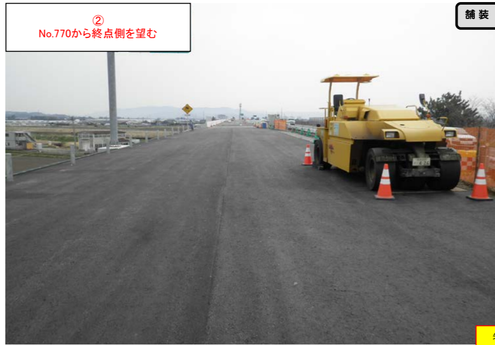
② No.770から終点側を望む