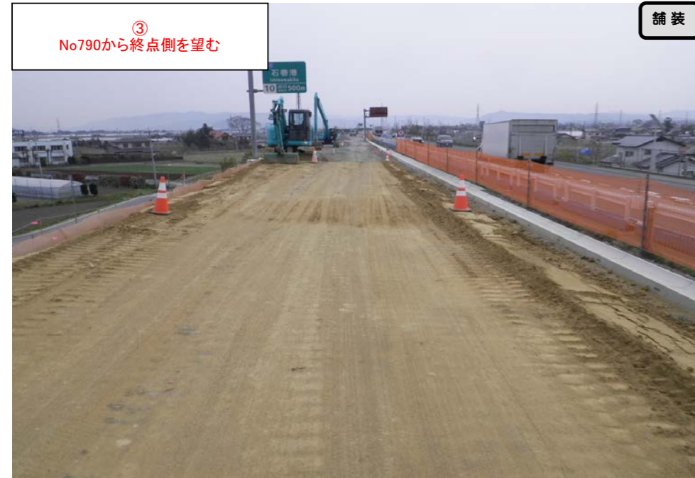
③ No.790から終点側を望む