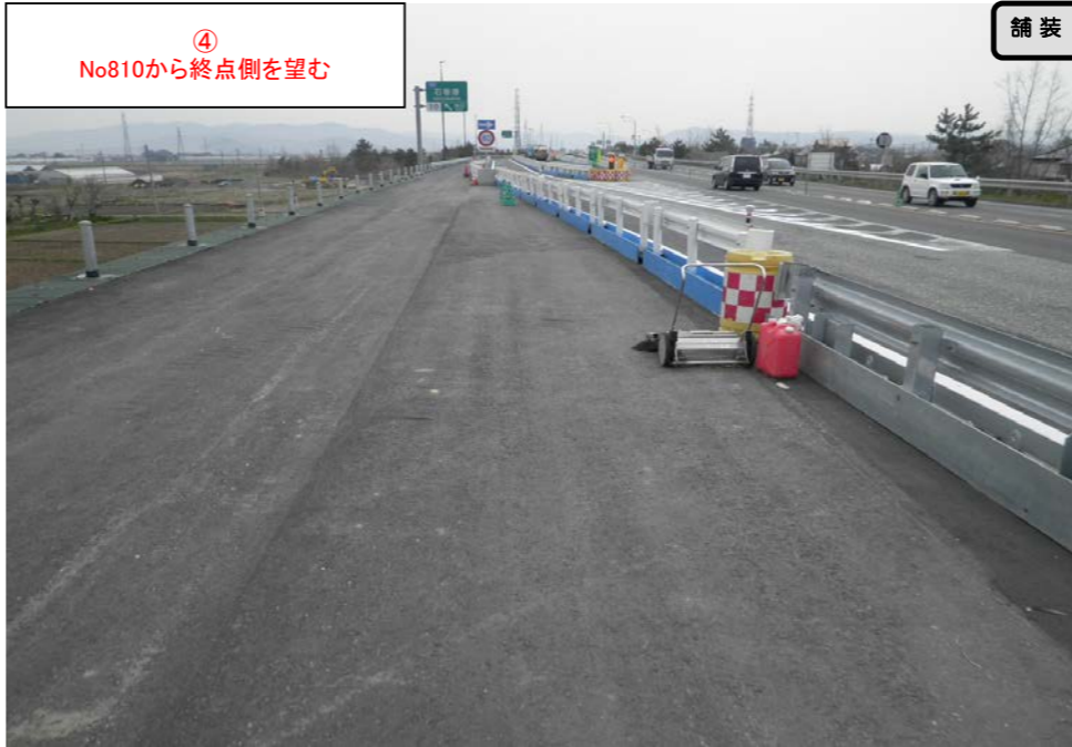
④ No.810から終点側を望む