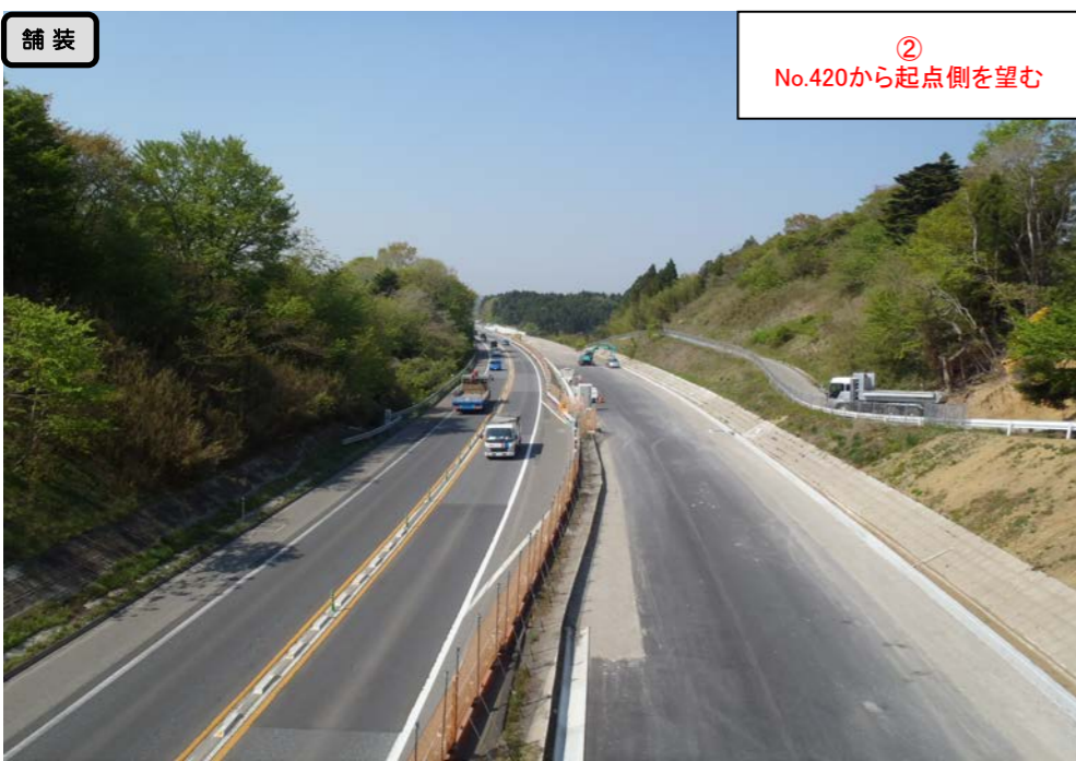
② No.420から起点側を望む