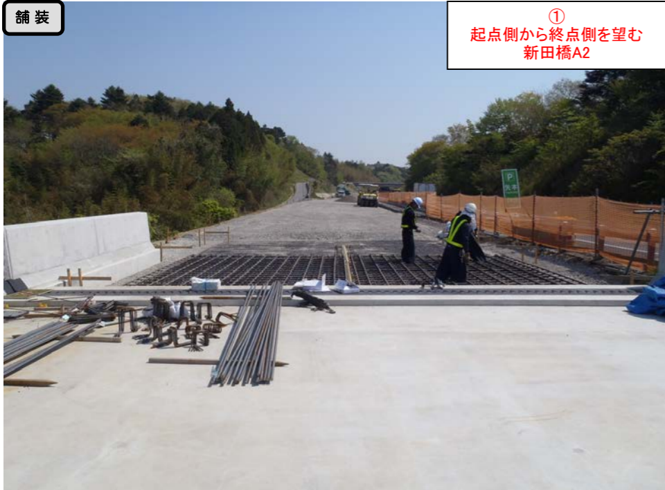
① 起点側から終点側を望む 新田橋A2

< 鳴瀬奥松島IC～石巻河南ICの延長12.4kmを4車線化事業中(2車線無料供用中) >