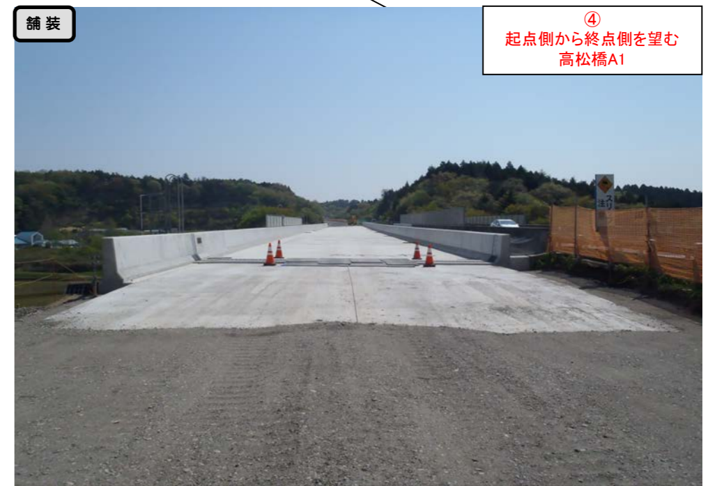
④ 起点側から終点側を望む 高松橋A1