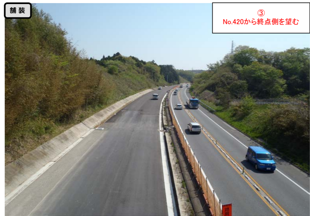
③ No.420から終点側を望む