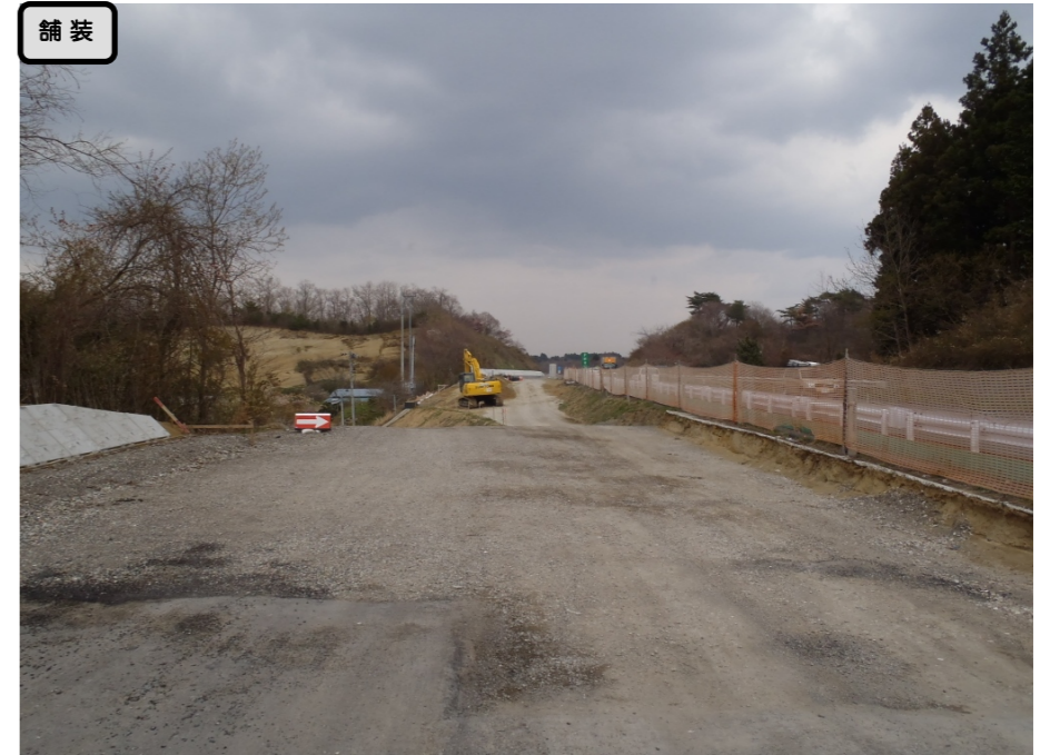
① No.494から終点側を望む