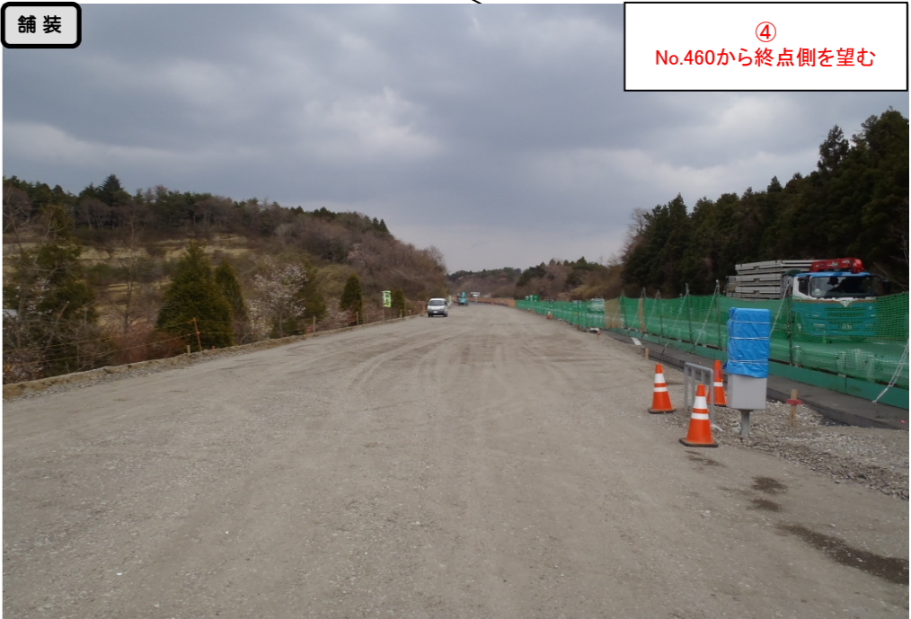
④ No.460から終点側を望む