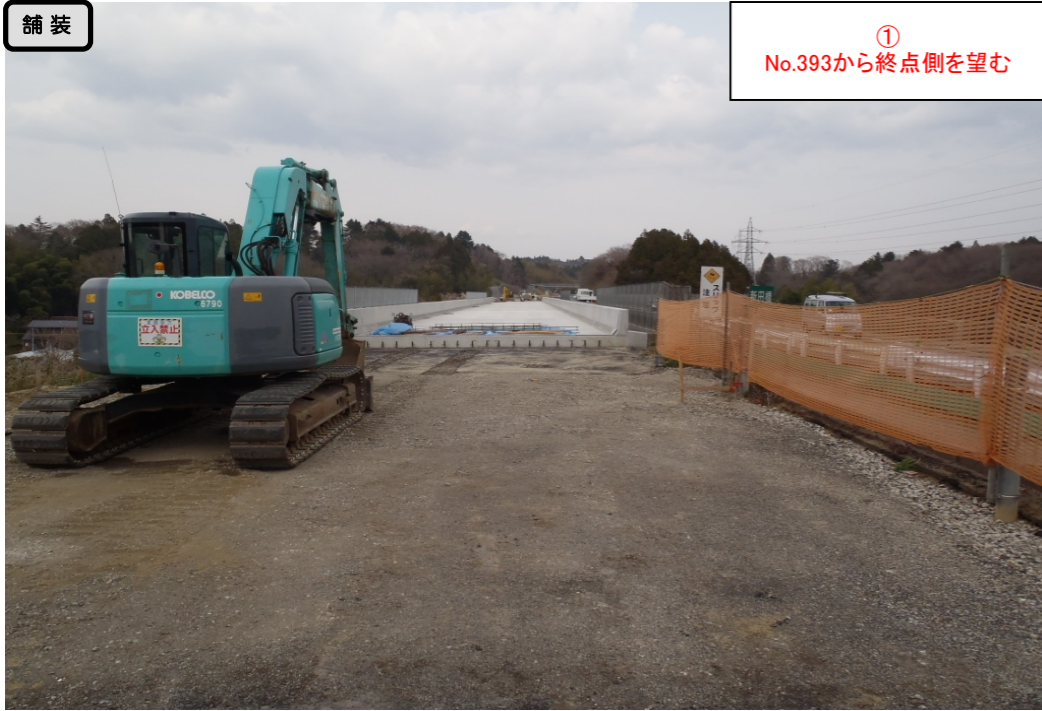
① No.393から終点側を望む

< 鳴瀬奥松島IC～石巻河南ICの延長12.4kmを4車線化事業中(2車線無料供用中) >