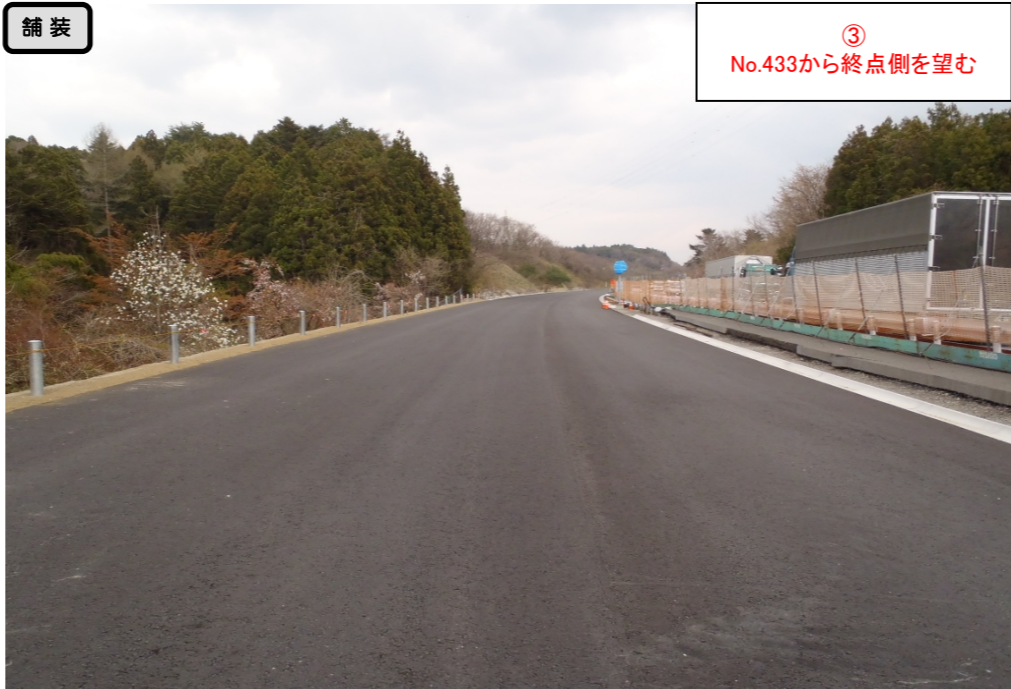
③ No.433から終点側を望む