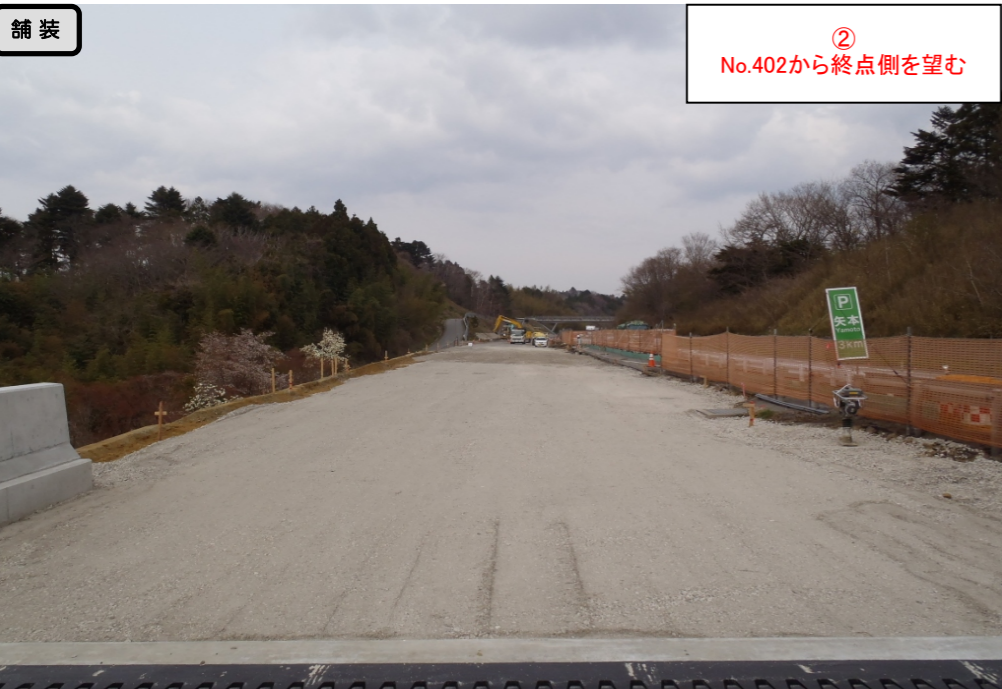
② No.402から終点側を望む