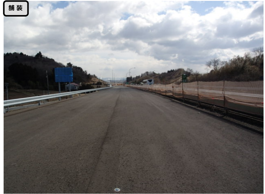
① No.538から終点側を望む