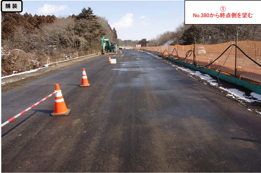
① No.380から終点側を望む

< 鳴瀬奥松島IC～石巻河南ICの延長12.4kmを4車線化事業中(2車線無料供用中) >