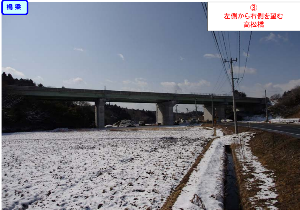
③ 左側から右側を望む 高松橋