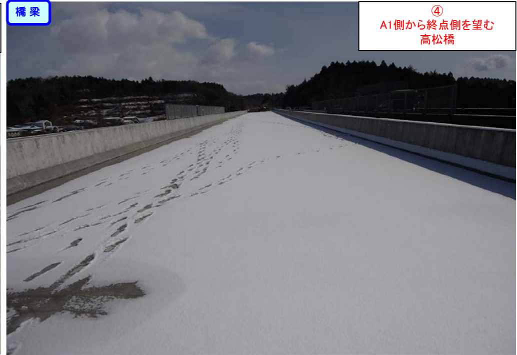
④ A1側から終点側を望む 高松橋