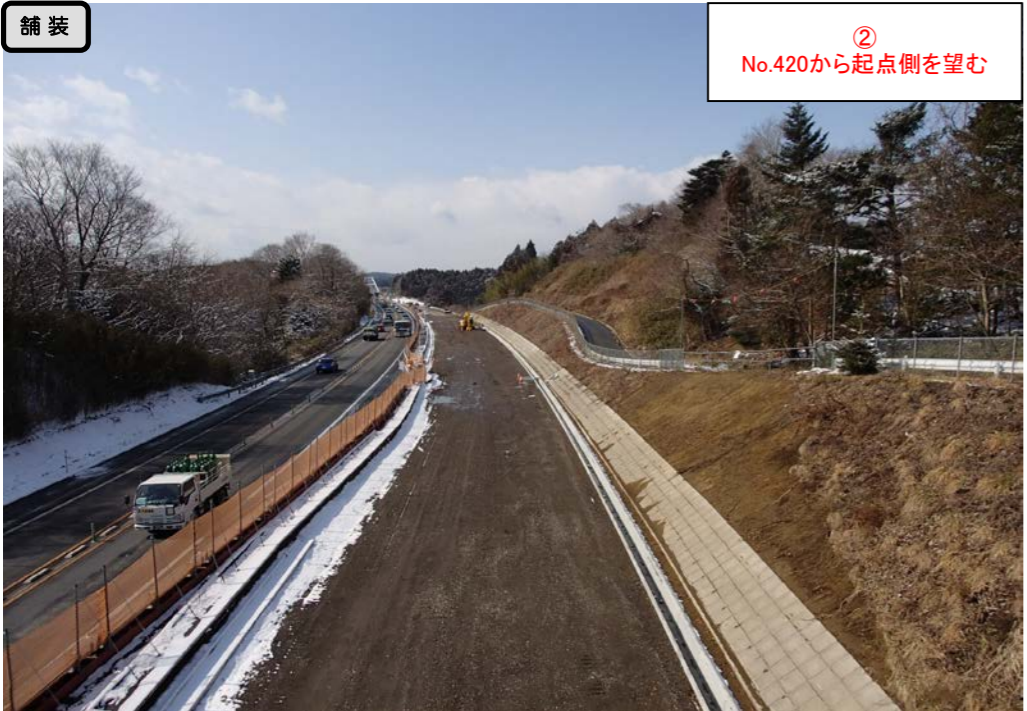
② No.420から起点側を望む