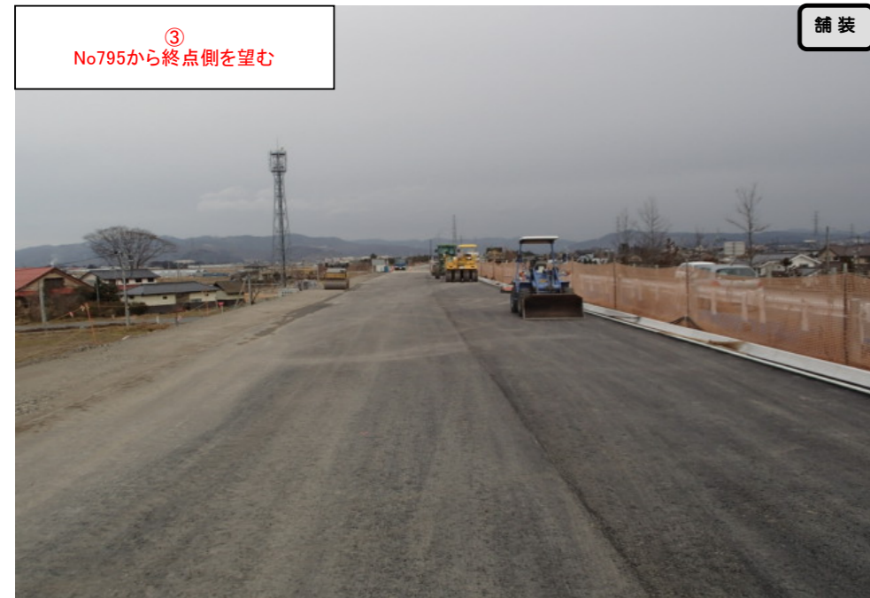
③ No.795から終点側を望む