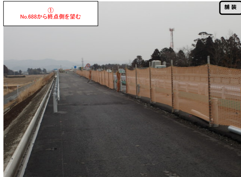
① No.688から終点側を望む