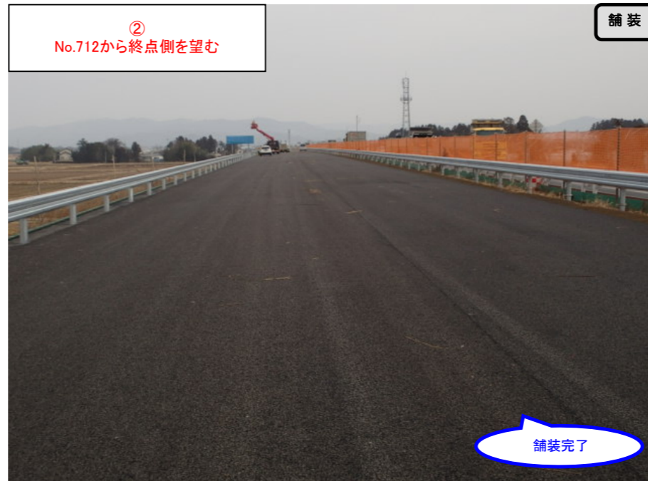
② No.712から終点側を望む