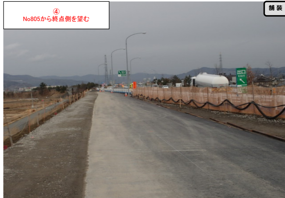
④ No.805から終点側を望む