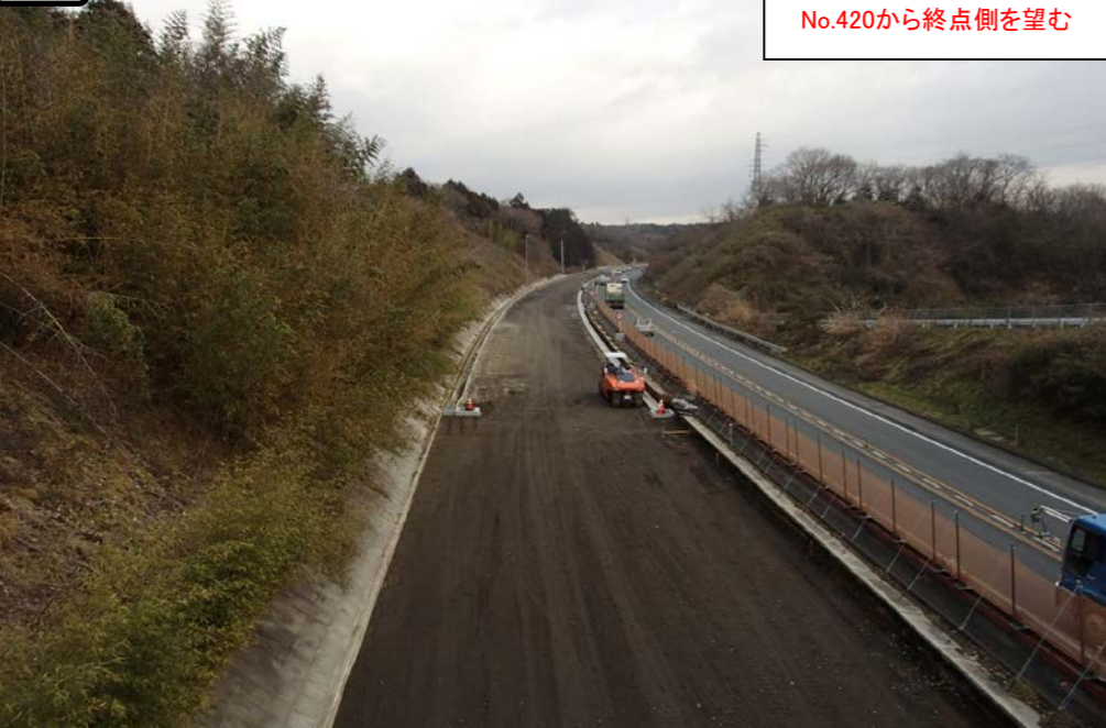
② No.420から終点側を望む