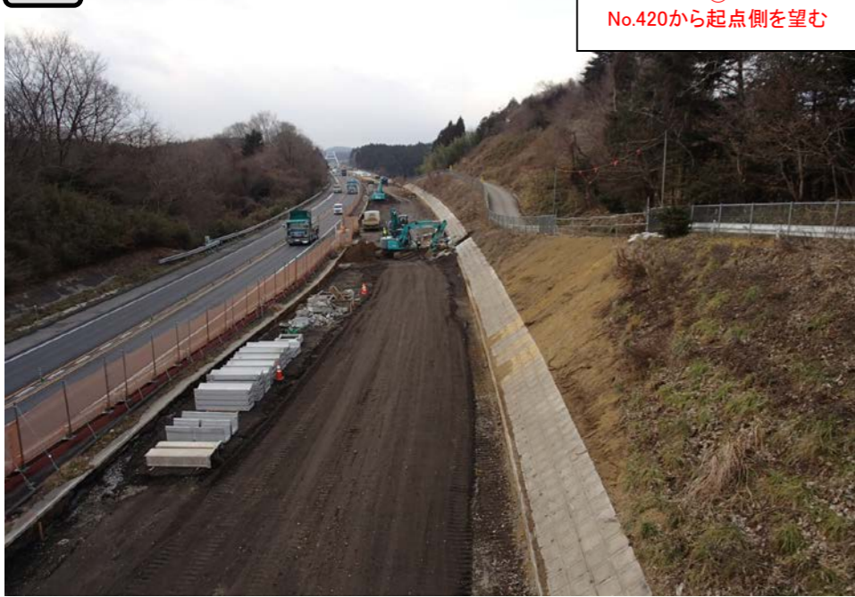
① No.420から起点側を望む