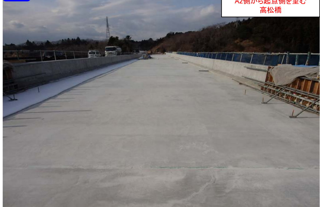
④ A2側から起点側を望む 高松橋