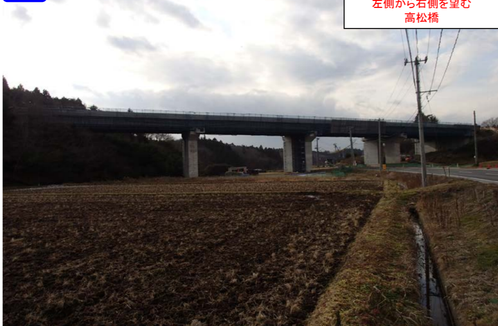
③ 左側から右側を望む 高松橋