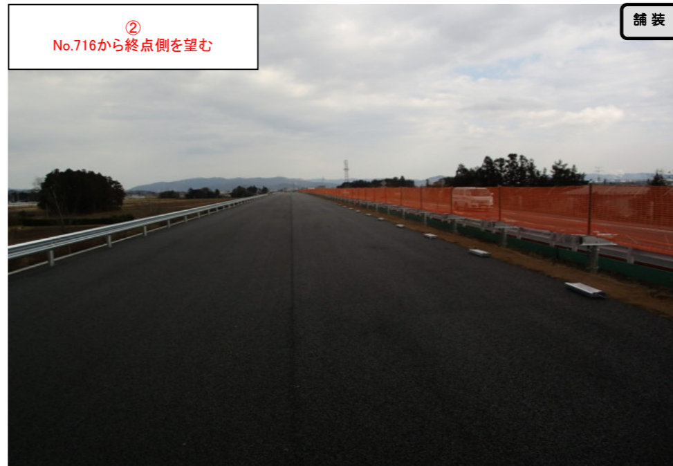
② No.716から終点側を望む