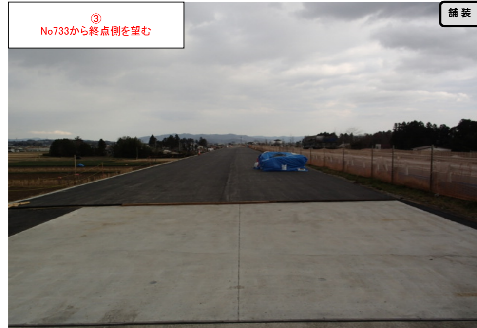
③ No733から終点側を望む