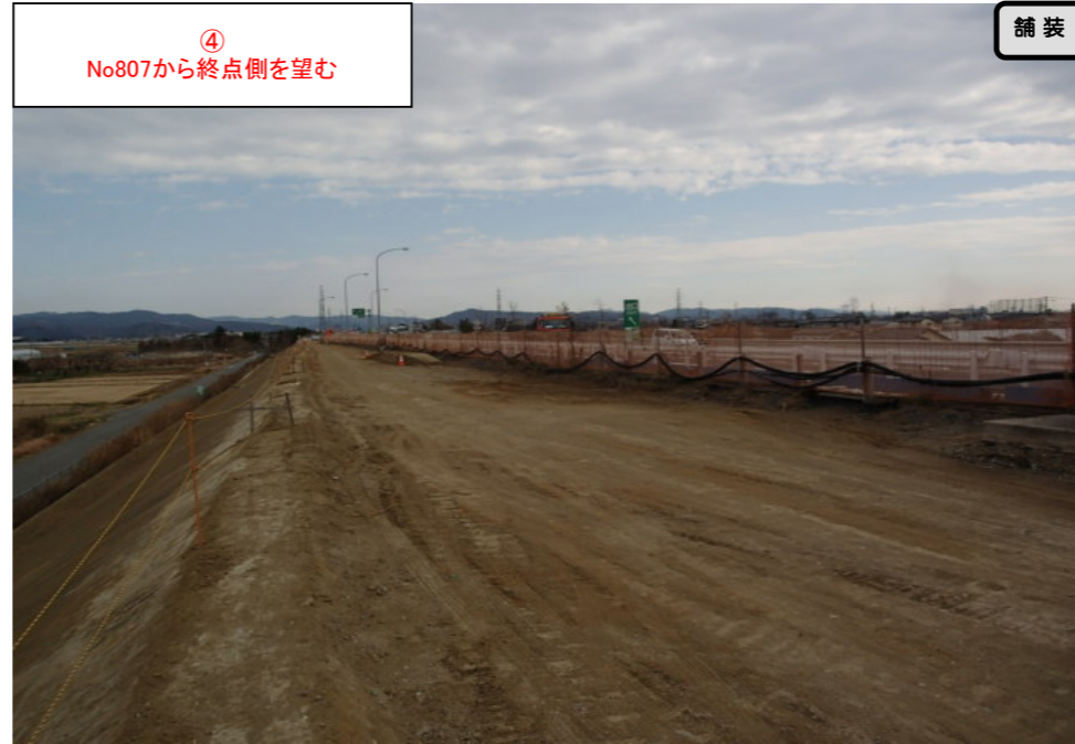
④ No807から終点側を望む