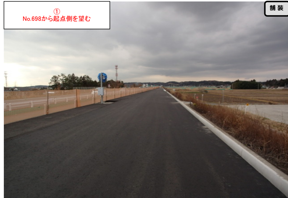
① No.698から起点側を望む