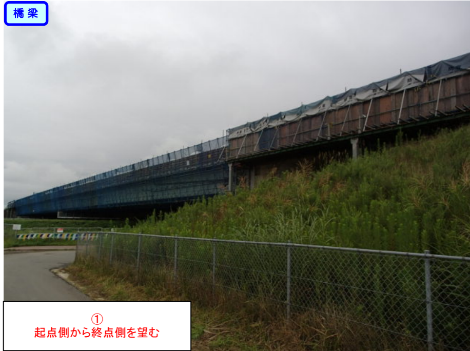
① 起点側から終点側を望む