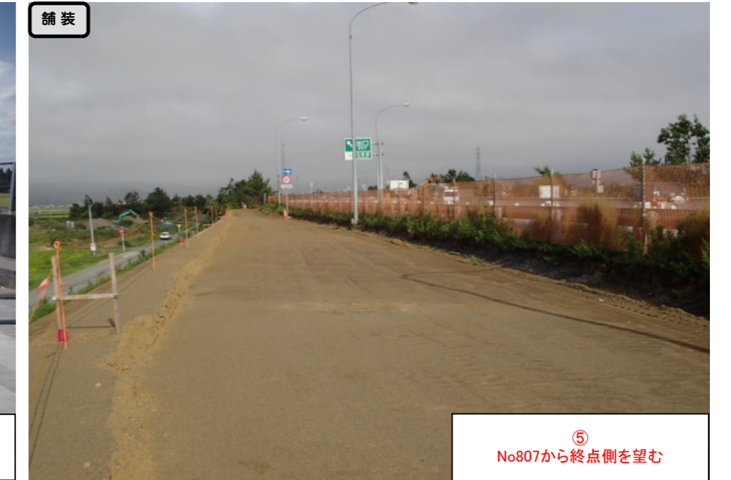
⑤ No807から終点側を望む