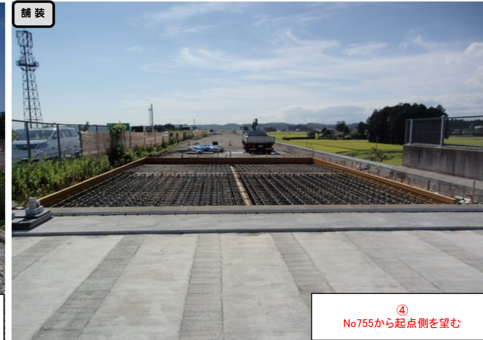
④ No755から起点側を望む