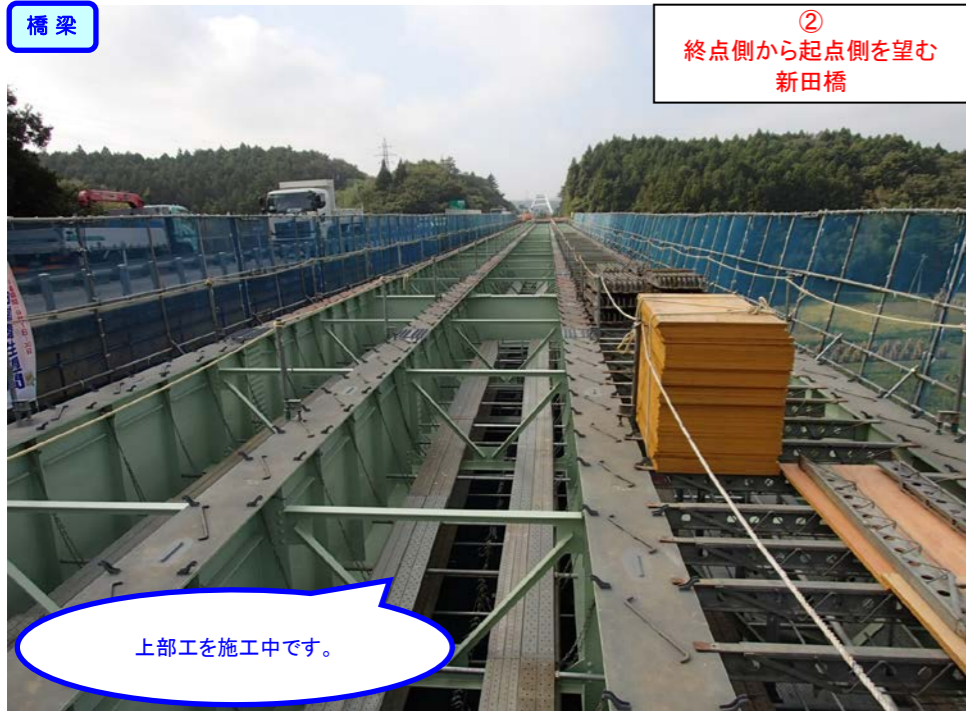
② 終点側から起点側を望む 新田橋