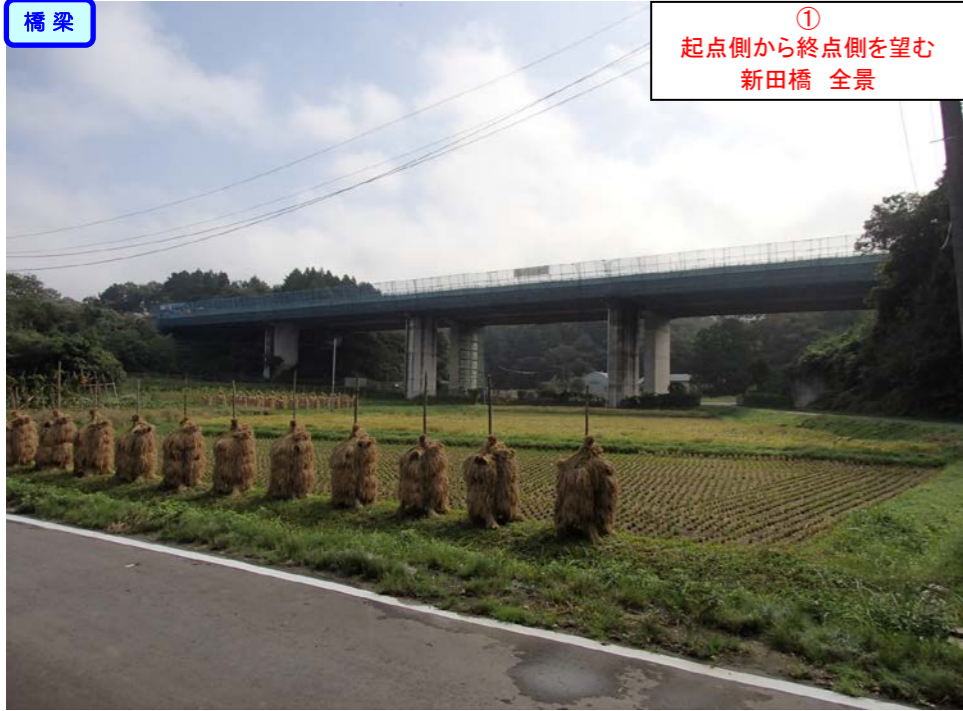
① 起点側から終点側を望む 新田橋 全景