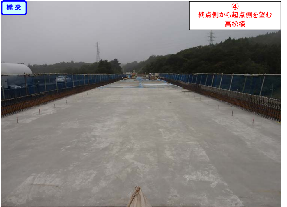
④ 終点側から起点側を望む 高松橋