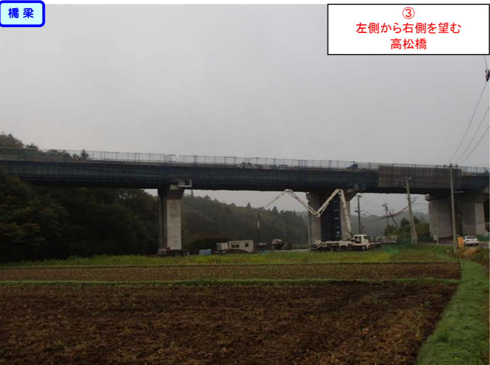
③ 左側から右側を望む 高松橋