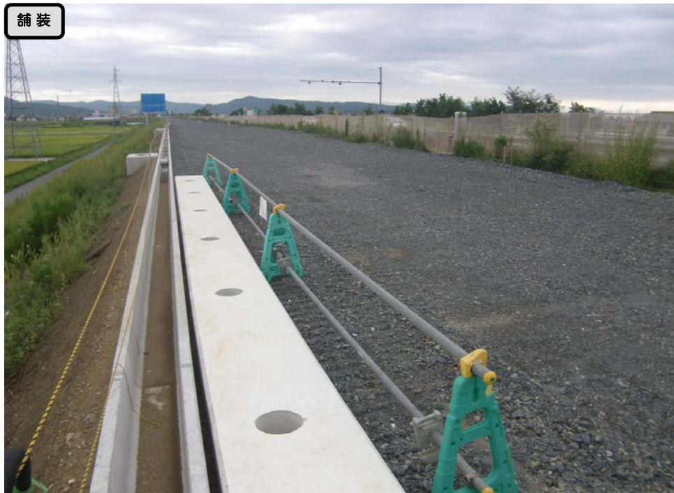
③ No.930から終点側を望む