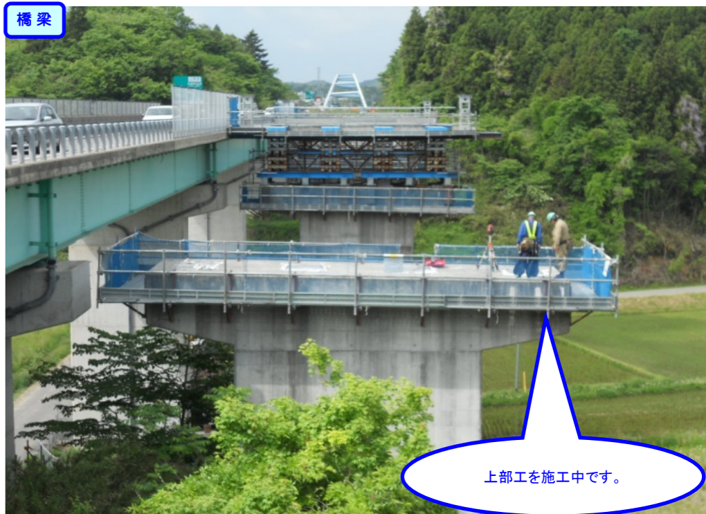
上部工を施工中です。