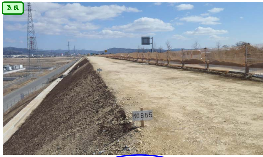
路体盛土が完了しました。