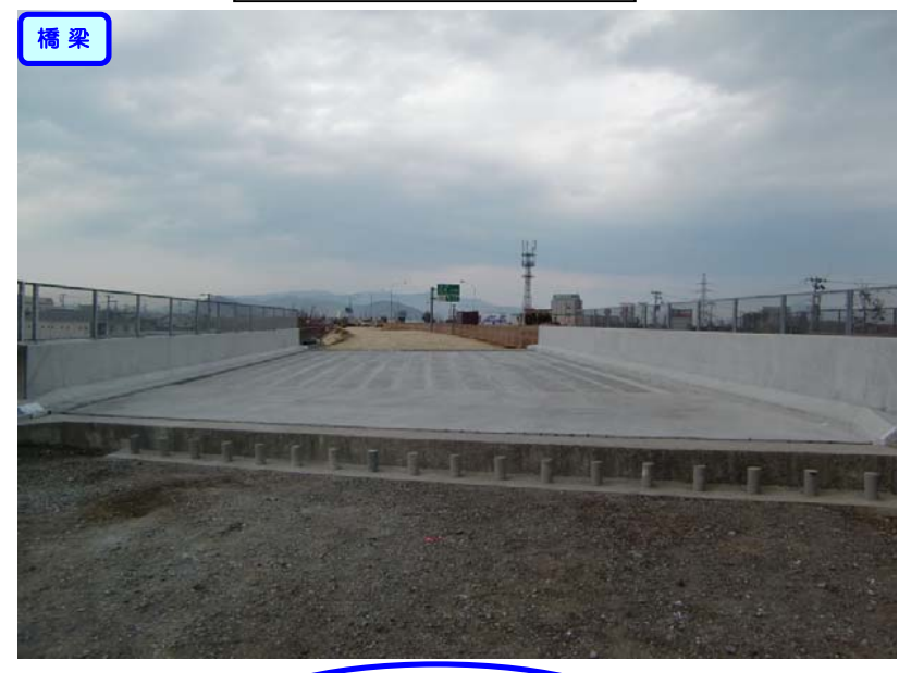
橋桁の設置が完了しました。