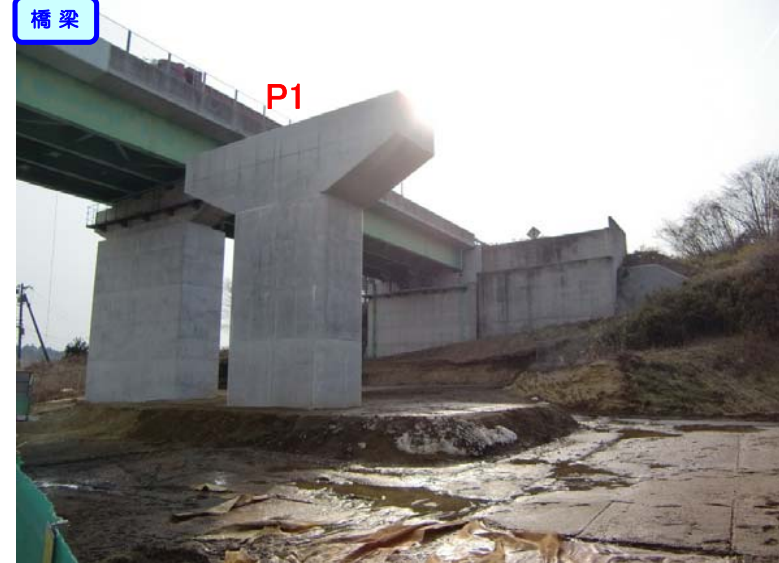
P1・P2・P3橋脚、A2橋台が完成しました。