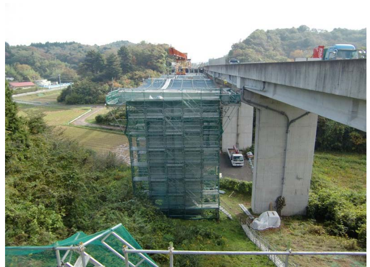
④ 上小松橋 橋脚(P2)