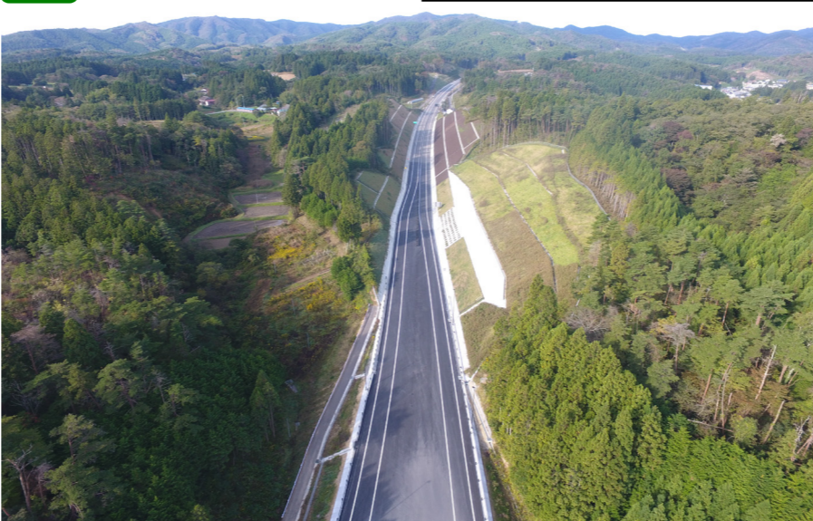
② No.835付近から起点側を望む