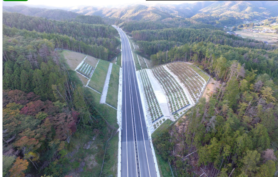
① No.715付近から起点側を望む