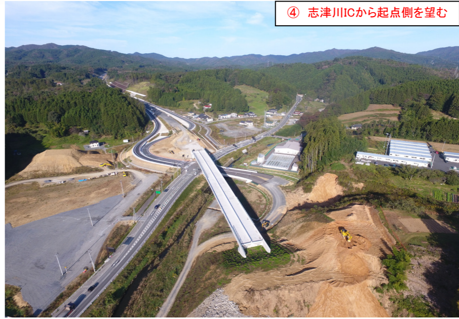
④ 志津川ICから起点側を望む