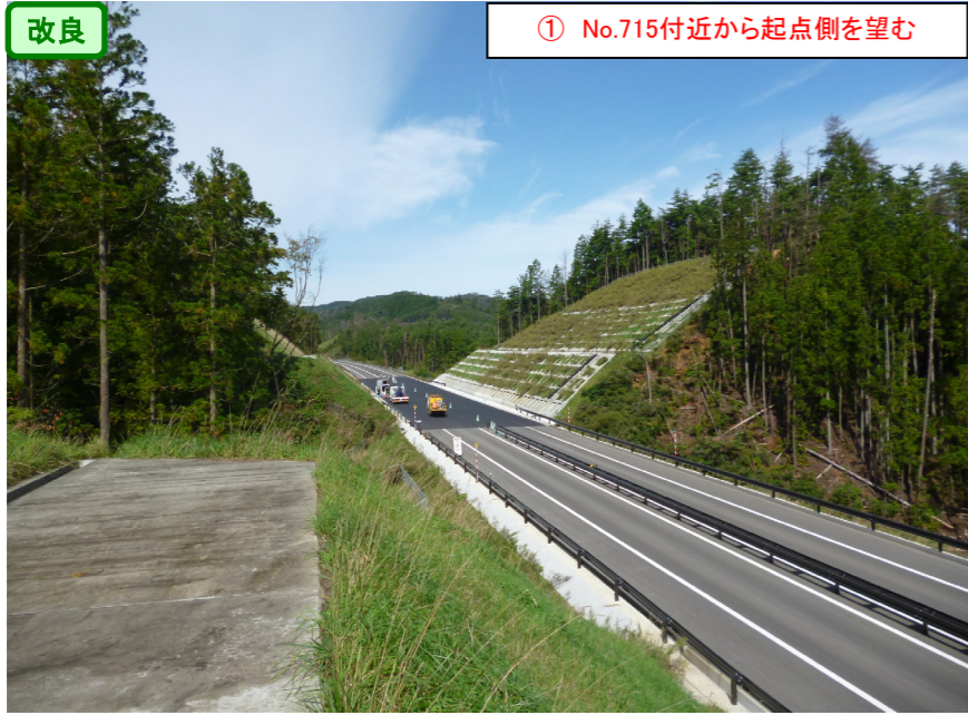
① No.715付近から起点側を望む