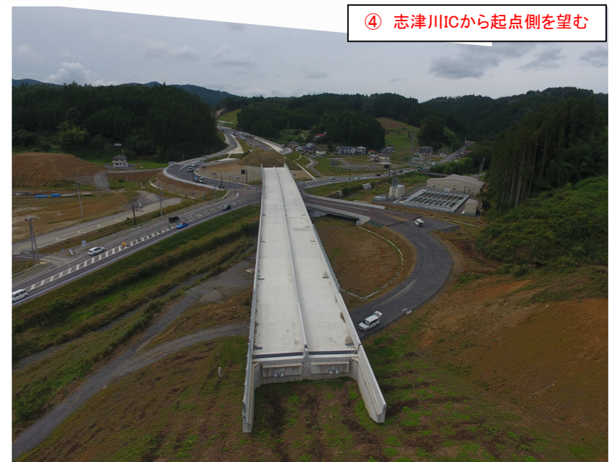
④ 志津川ICから起点側を望む