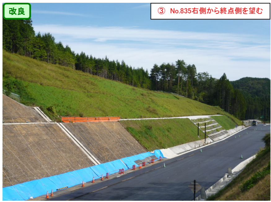
③ No.835右側から終点側を望む