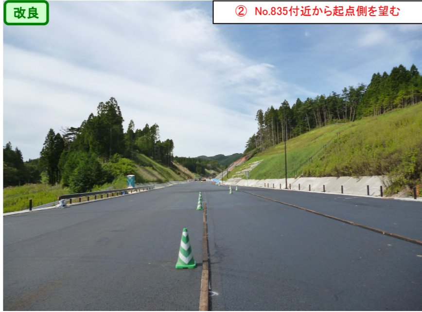
② No.835付近から起点側を望む