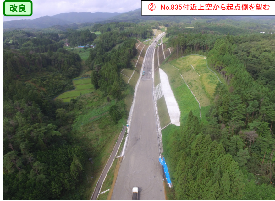
② No.835付近上空から起点側を望む

登米志津川地区舗装工事 受注者：(株)NIPPO 工期：H27. 12. 10～H28. 10. 31