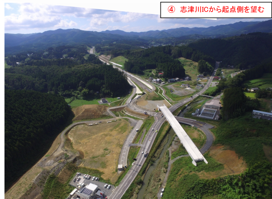
④ 志津川ICから起点側を望む

桜沢地区道路改良工事 受注者：(株)柿崎工務所 工期：H28. 7. 21～H29. 3. 17