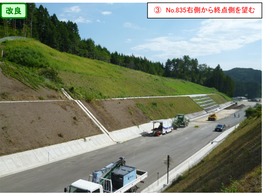
③ No.835右側から終点側を望む

桜沢地区道路改良工事 受注者：(株)柿崎工務所 工期：H28. 7. 21～H29. 3. 17