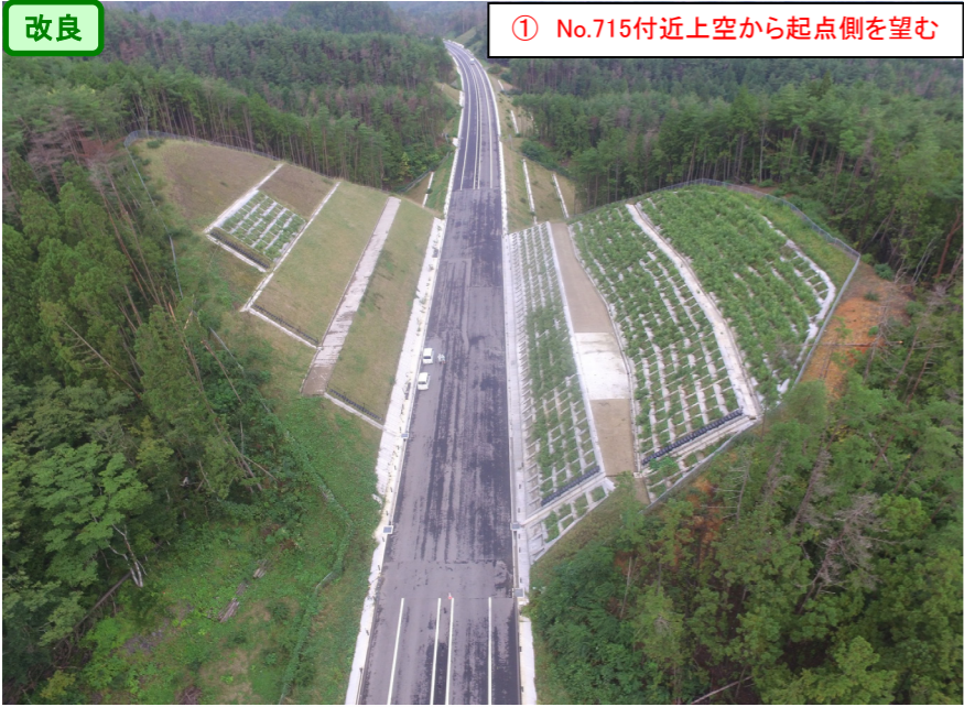
① No.715付近上空から起点側を望む