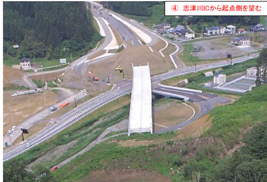
④ 志津川ICから起点側を望む