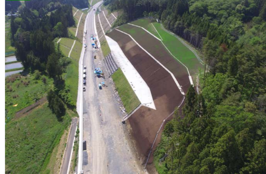
② No.835付近上空から起点側を望む