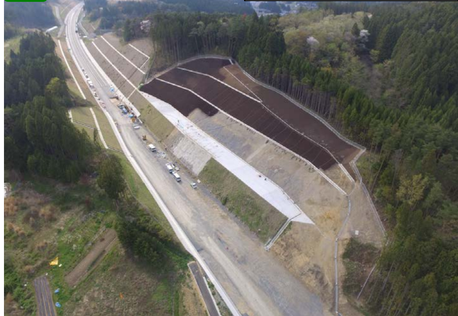
③ No.835付近上空から起点側を望む