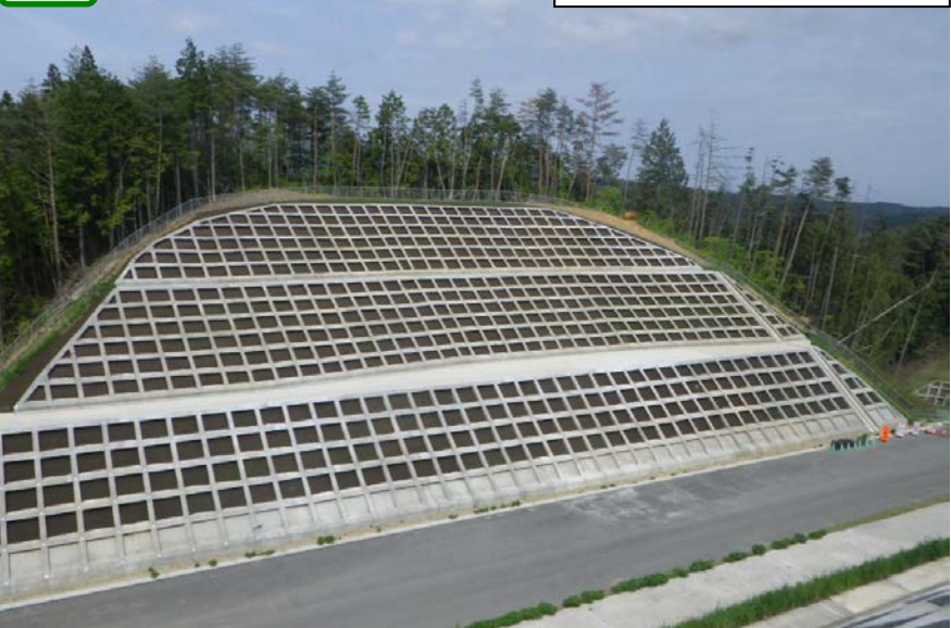
② No.715右側から左側を望む