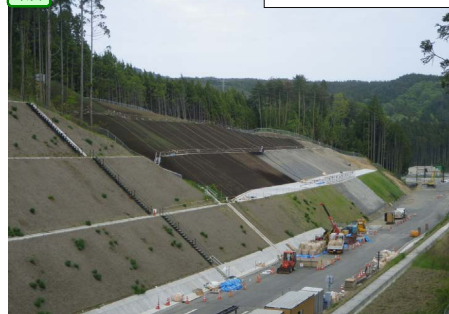
④ No.835右側から終点側を望む