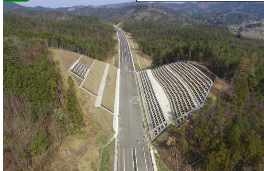
① No.715付近上空から起点側を望む