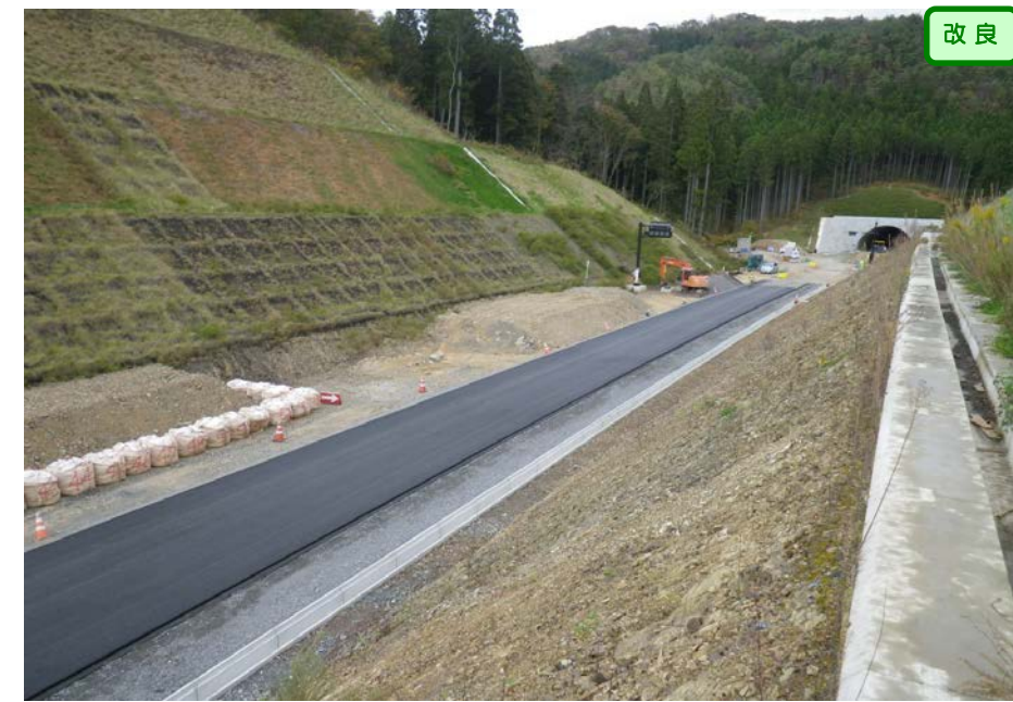
② 起点側から終点側を望む