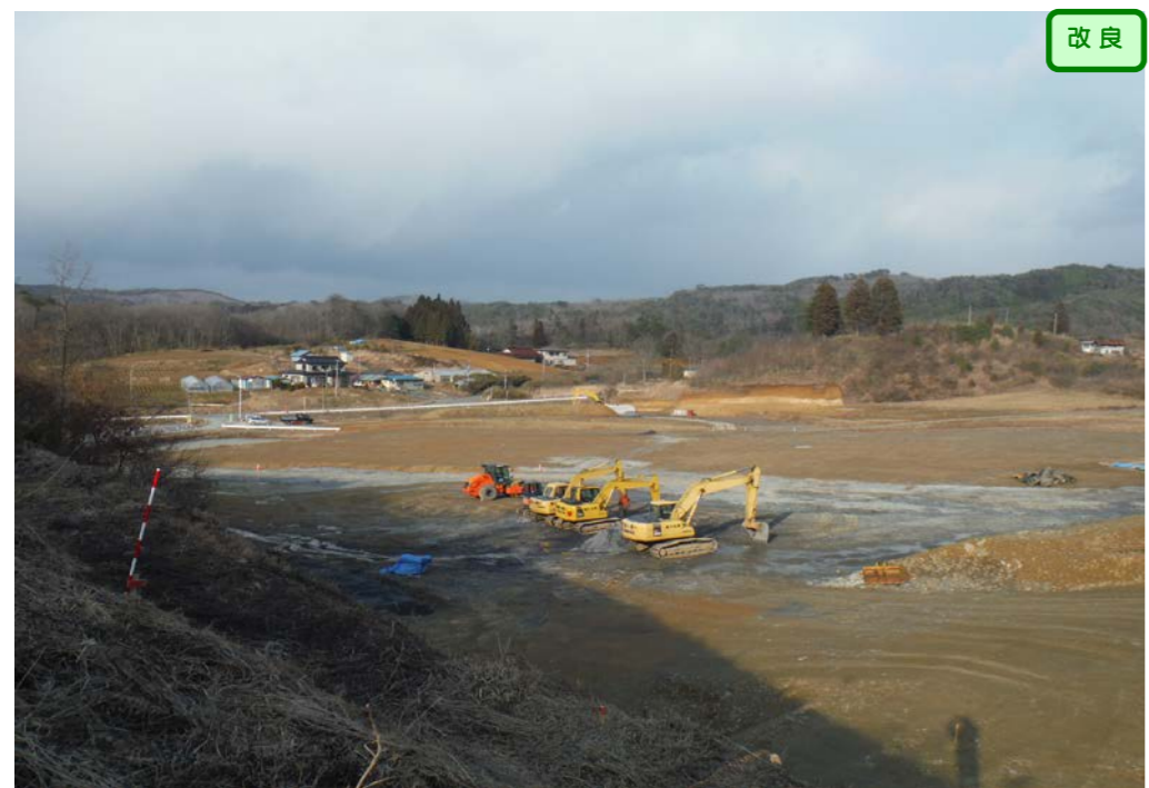
③ 起点側から終点側を望む 大岩久保沢橋