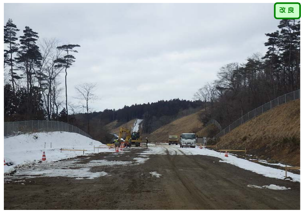
③ 終点側から起点側を望む 大岩久保沢橋