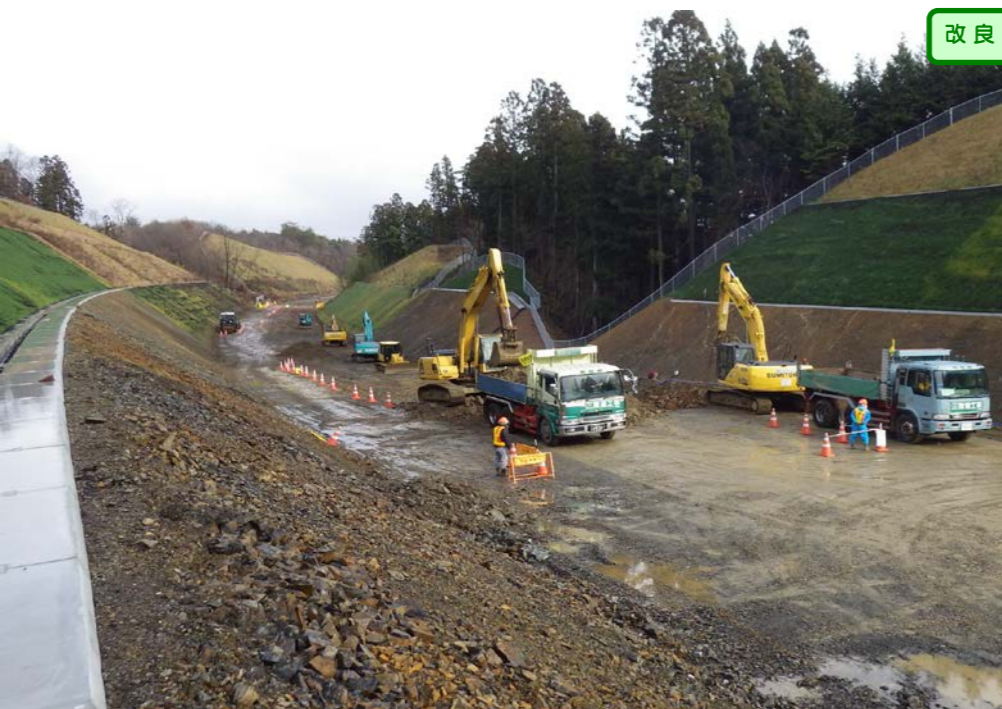
③ 終点側から起点側を望む 大岩久保沢橋