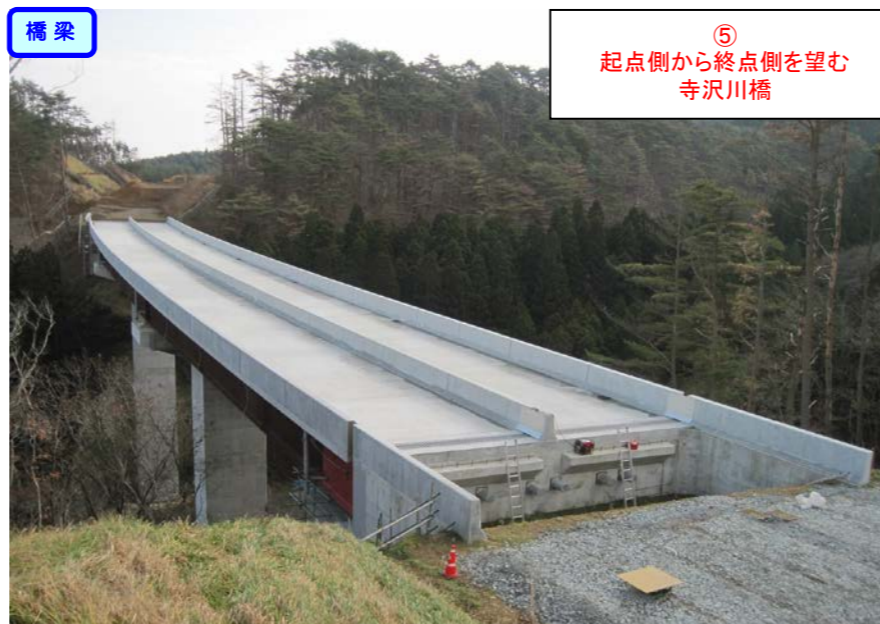
⑤ 起点側から終点側を望む 寺沢川橋