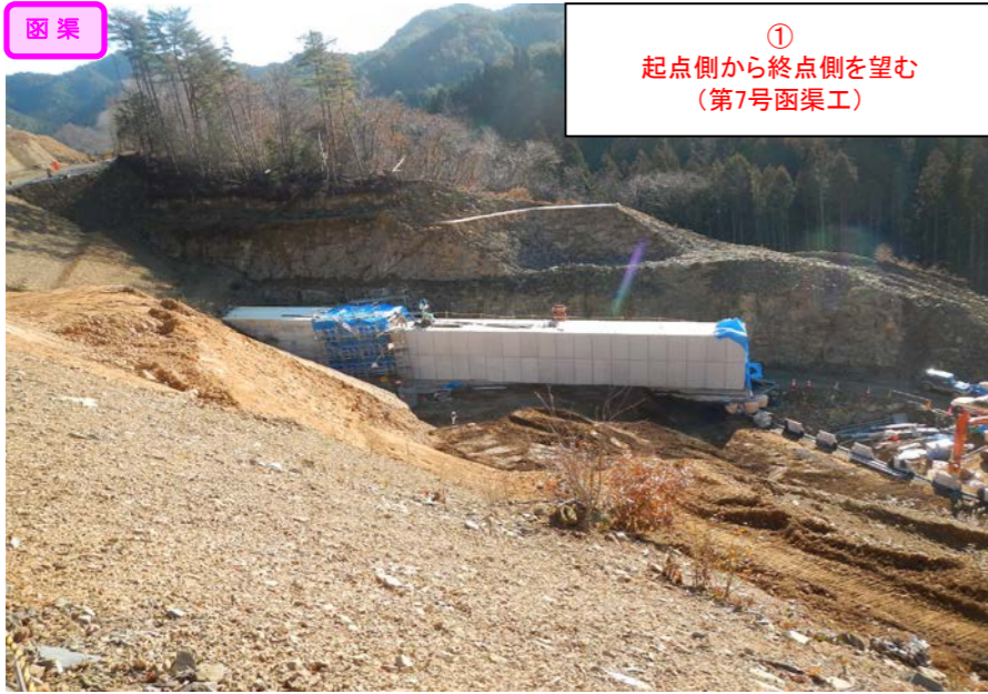
① 起点側から終点側を望む (第7号函渠工)

< 登米東和IC～志津川ICの延長11.1kmを暫定2車線事業中(登米IC～登米東和ICの延長5.0km無料共用中) >