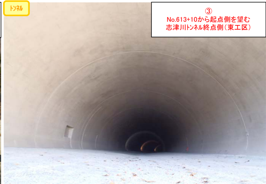
③ No.613+10から起点側を望む 志津川トンネル終点側(東工区)

国道45号 登米志津川道路上部工工事 受注者：川田工業(株) 工期：H24.3.22～H26.1.31