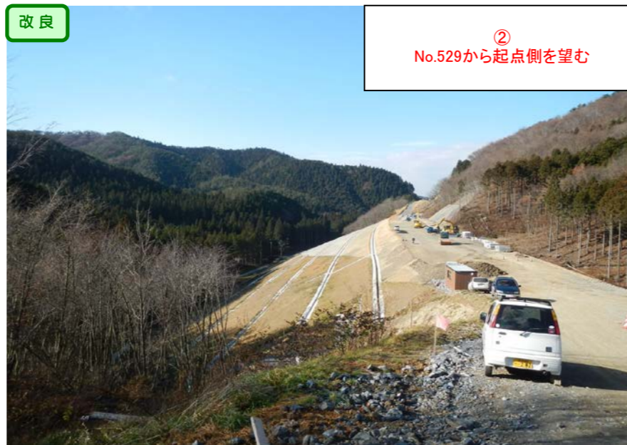
② No.529から起点側を望む