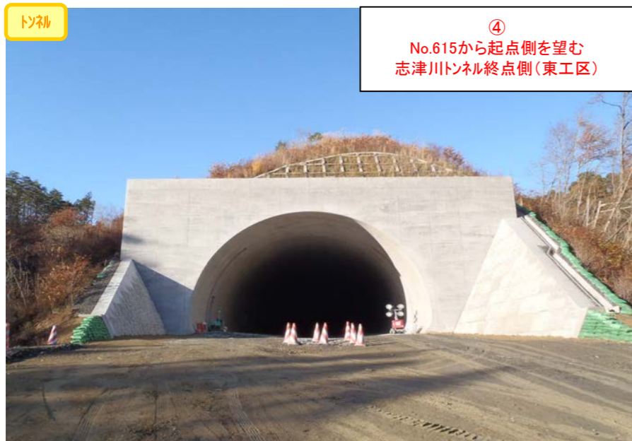
④ No.615から起点側を望む 志津川トンネル終点側(東工区)