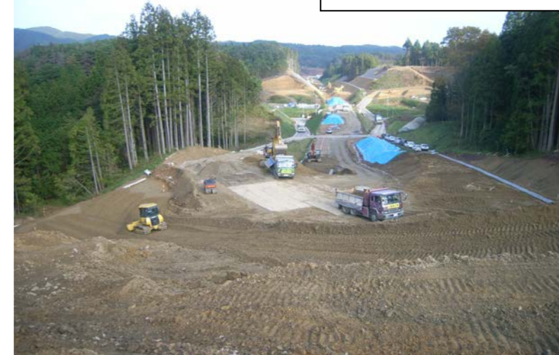
③ No.807から起点側を望む