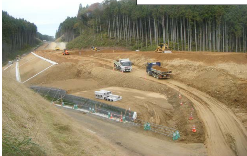
① No.778から起点側を望む