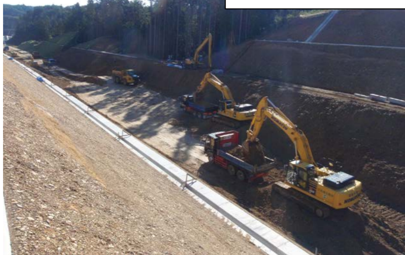
④ No.825から終点側を望む