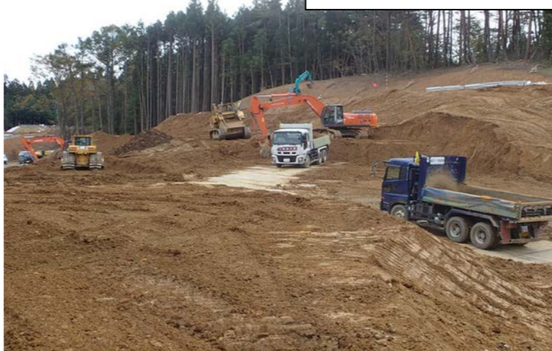
② No.795から終点側を望む