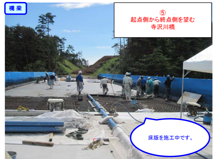
⑤ 起点側から終点側を望む 寺沢川橋