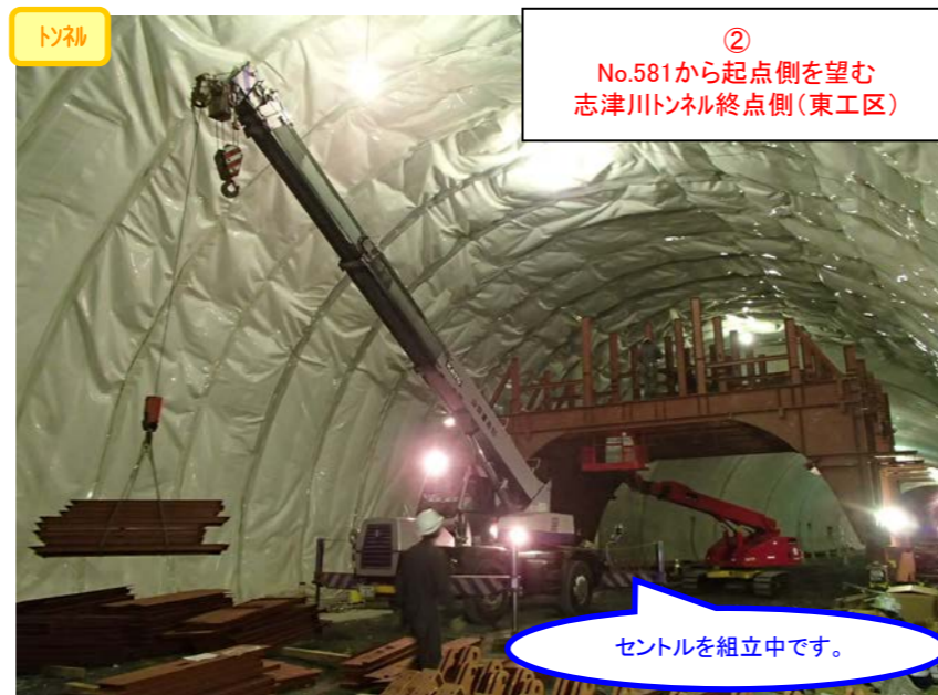
② No.581から起点側を望む 志津川トンネル終点側(東工区)