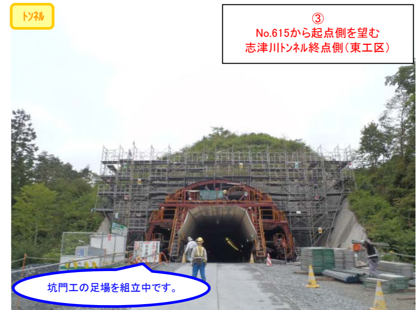
③ No.615から起点側を望む 志津川トンネル終点側(東工区)