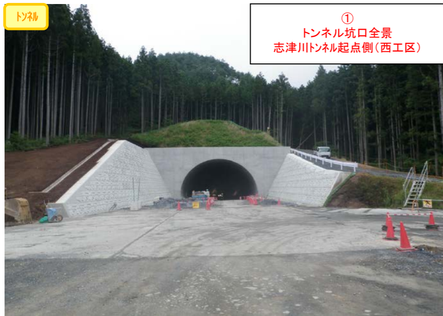
① トンネル坑口全景 志津川トンネル起点側(西工区)

< 登米東和IC～志津川ICの延長11.1kmを暫定2車線事業中(登米IC～登米東和ICの延長5.0km無料共用中) >