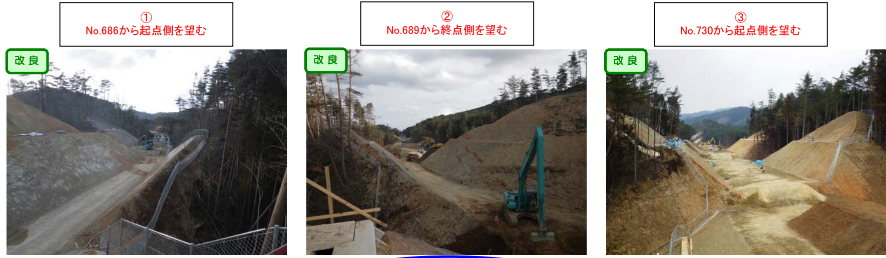
① No.686から起点側を望む