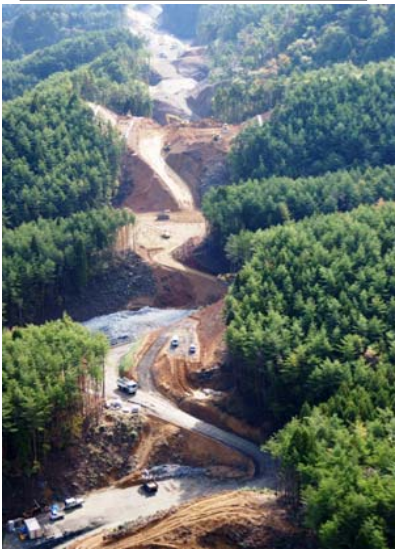
② No.702から終点側を望む (航空写真)