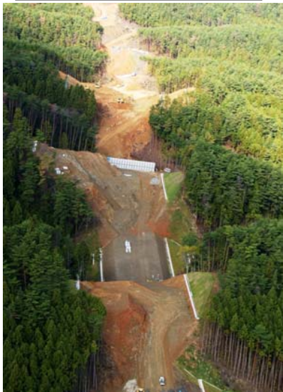
③ No.713から終点側を望む (航空写真)