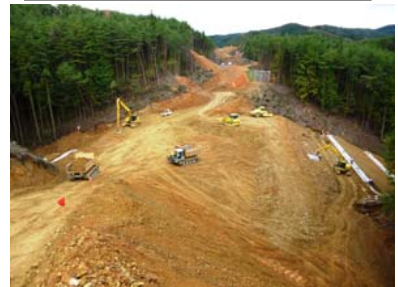
④ No.715から終点側を望む