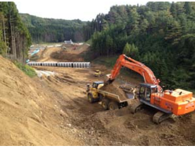
⑨ No.840から終点側を望む