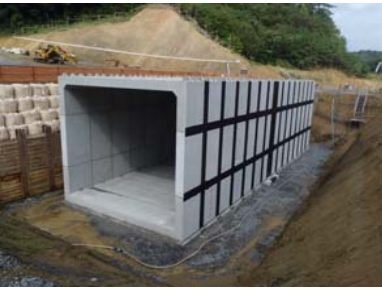
⑧ No.817から起点側を望む 信倉線 函渠工