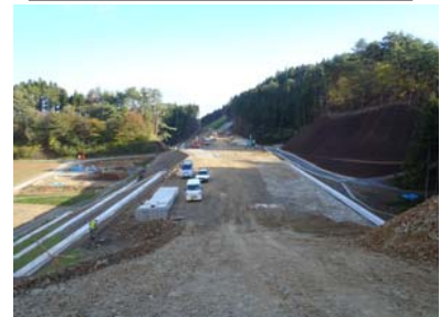
⑤ No.733から終点側を望む