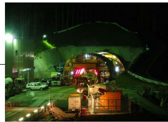
② No.539から終点側を望む 志津川トンネル起点側(西工区) 夜間 [スライドセンター]