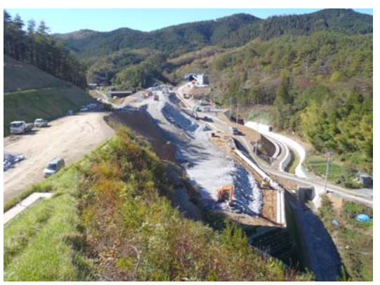
⑦ No.625から起点側を望む 志津川トンネル終点側(東工区)