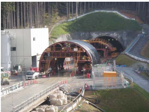
① No.539から終点側を望む 志津川トンネル起点側(西工区) [スライドセンター]