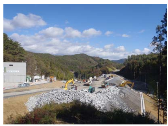
⑤ No.614から終点側を望む