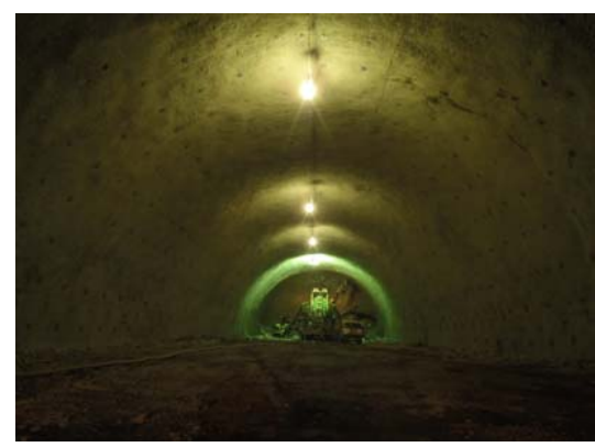
④ 坑内掘削部側を望む 志津川トンネル起点側(東工区)