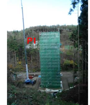
⑥ No.428から終点側を望む 福平橋 橋脚(P1)