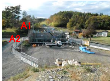
② No.329から起点側を望む 沢尻橋 全景 橋台(A1 A2)