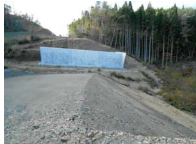
③ No.402から終点側を望む 第4号函渠工