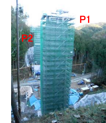
⑪ No.482から終点側を望む 大岩久保沢橋 橋脚(P1)