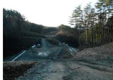
⑨ No.470から起点側を望む