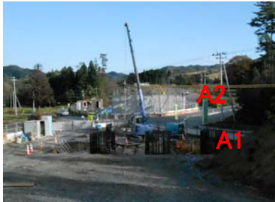
① No.326から終点側を望む 沢尻橋 全景 橋台(A1 A2)