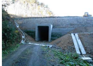
⑧ 右側からNo.450を望む 第5号函渠工