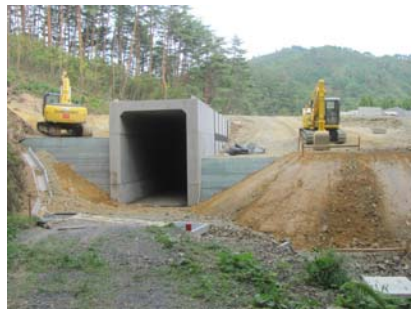
⑤ R側からNo.450を望む 第5号函渠工