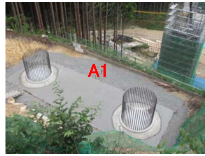
⑦ No.481から終点側を望む 大岩久保沢橋 橋台(A1)