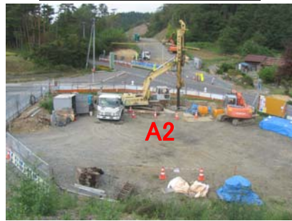
① No.330から起点側を望む 沢尻橋 橋台(A2)