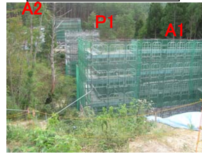
② No.427から終点側を望む 福平橋 全景 橋台(A1 A2) 橋脚(P1)