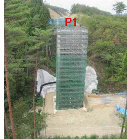
③ No.433から起点側を望む 福平橋 橋脚(P1)