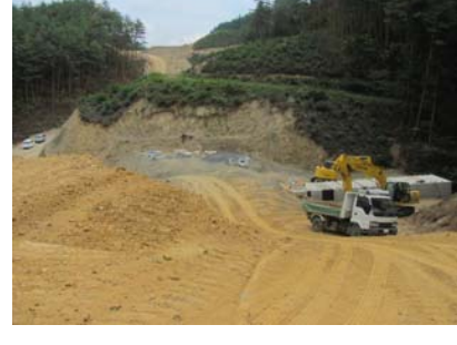
④ No.449から終点側を望む