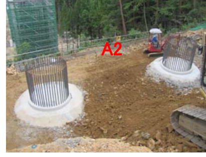
⑨ No.490から起点側を望む 大岩久保沢橋 橋台(A2)